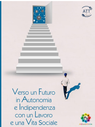
Foto: Locandina del progetto