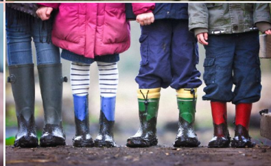
Foto rappresentativa del Piano di Inclusione Sociale (Area 2)