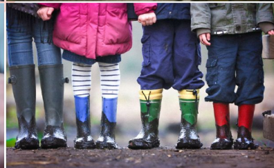
Foto rappresentativa del Piano di Inclusione Sociale (Area 2)