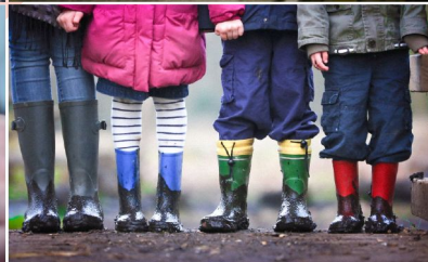
Foto rappresentativa del Piano di Inclusione Sociale (Area 2)