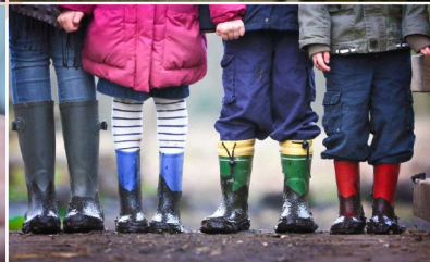
Foto rappresentativa del Piano di Inclusione Sociale (Area 2)