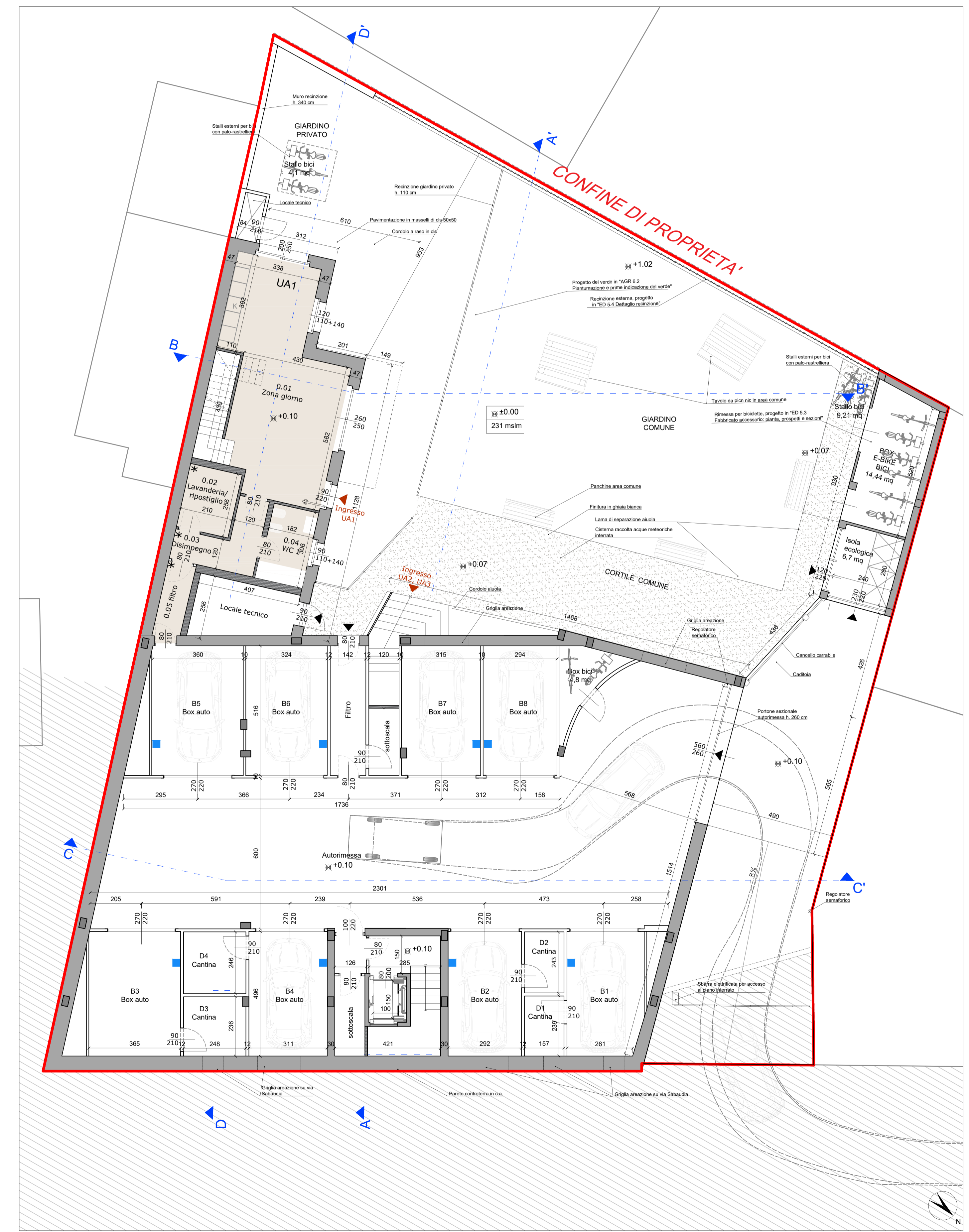
Pianta piano seminterrato - scala 1:100