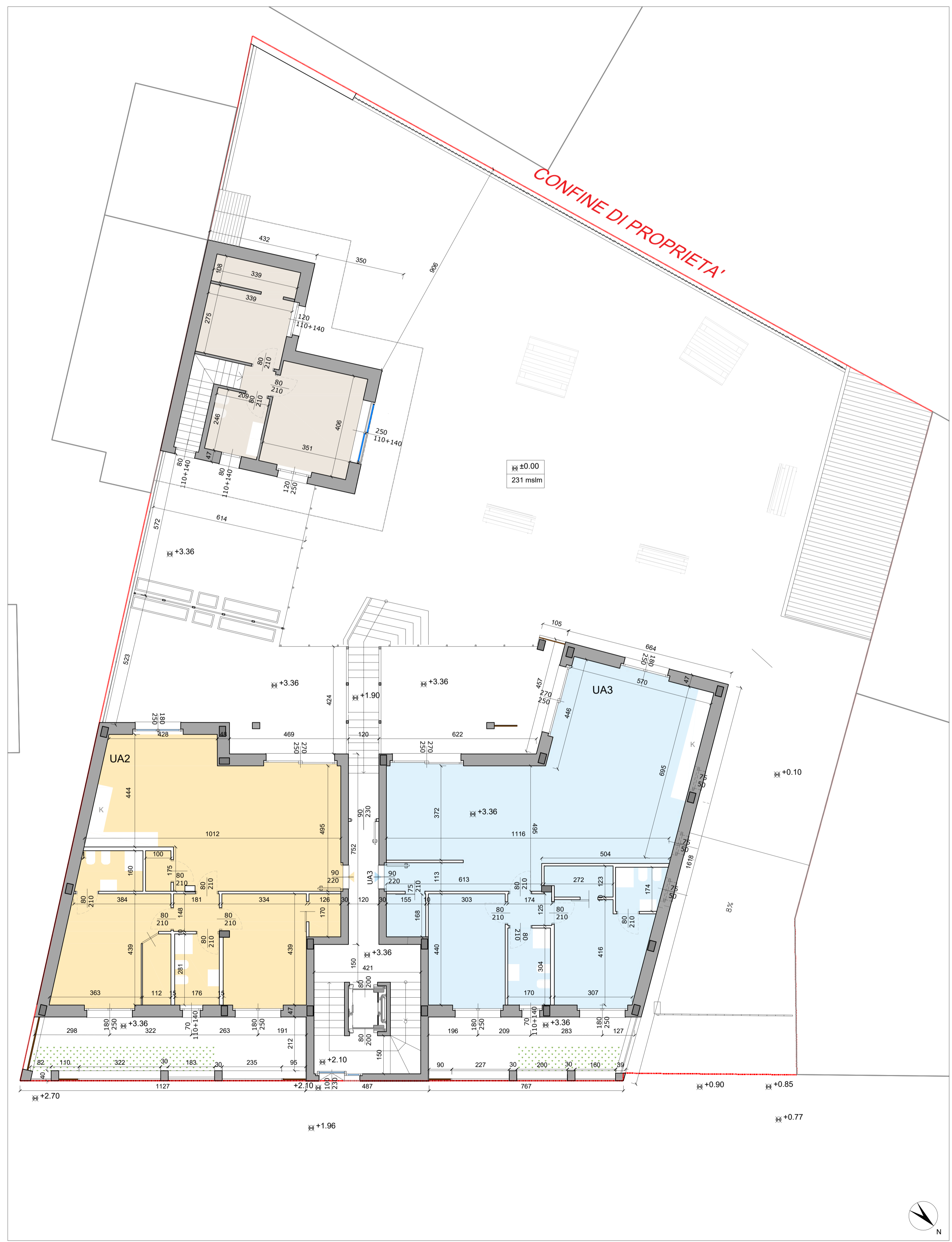
Pianta rialzato - scala 1:100