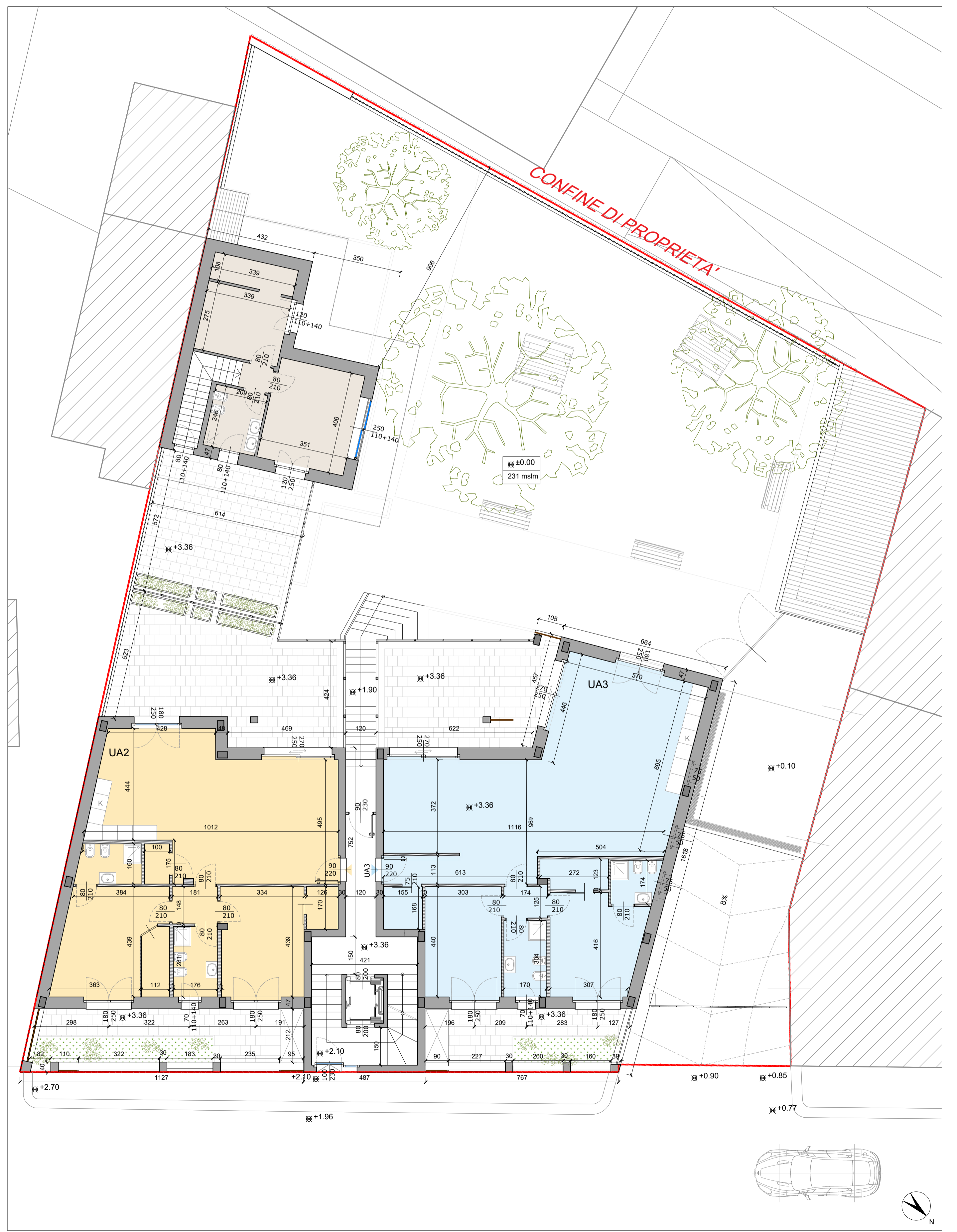
Pianta rialzato - scala 1:100