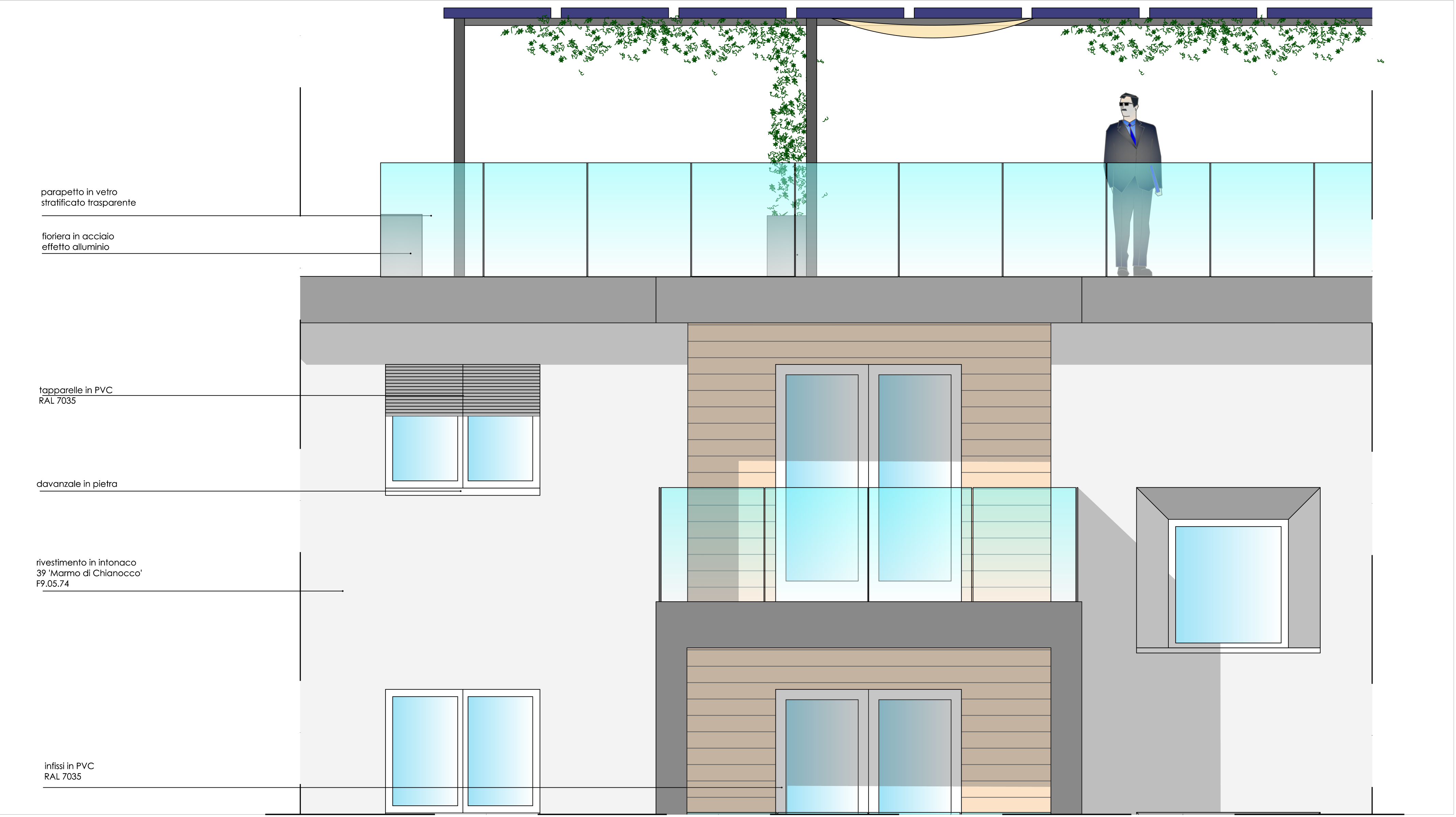
PARTICOLARE COSTRUTTIVO - PROSPETTO 1:25