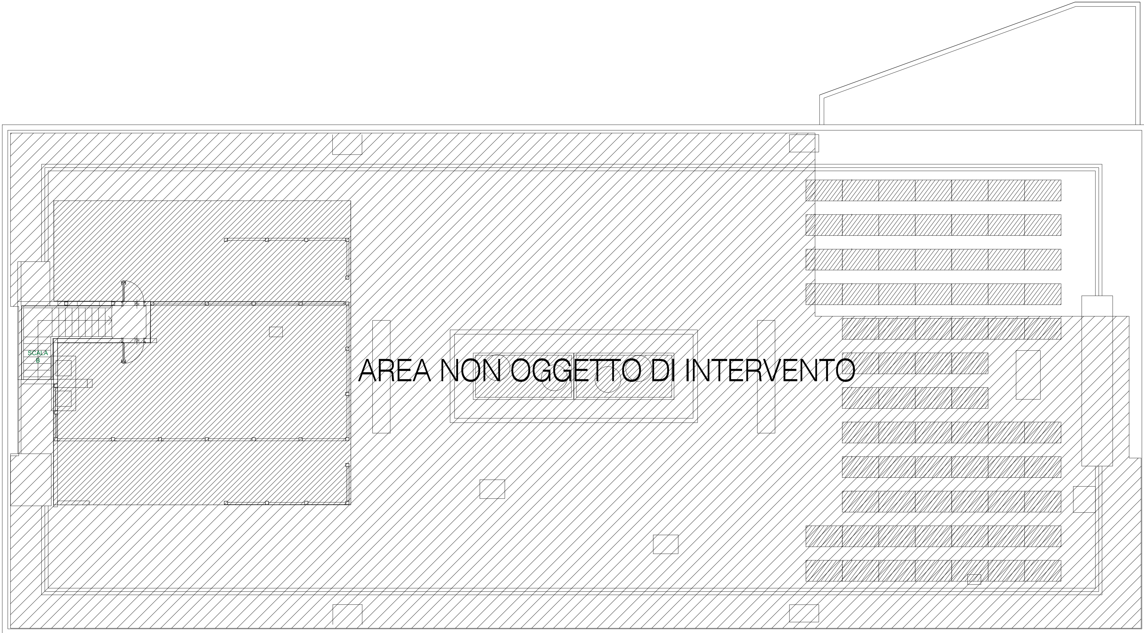
PIANTA PIANO COPERTURE STATO DI FATTO