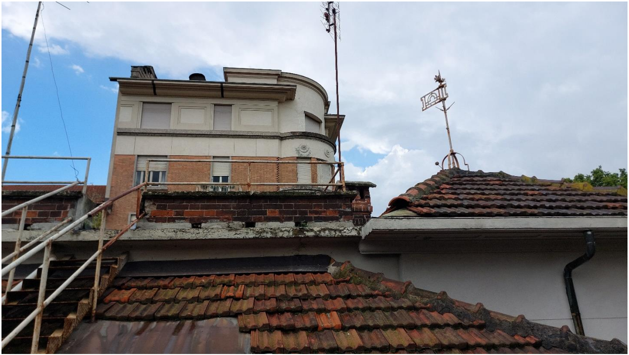
Prospetto nord – dettaglio della copertura