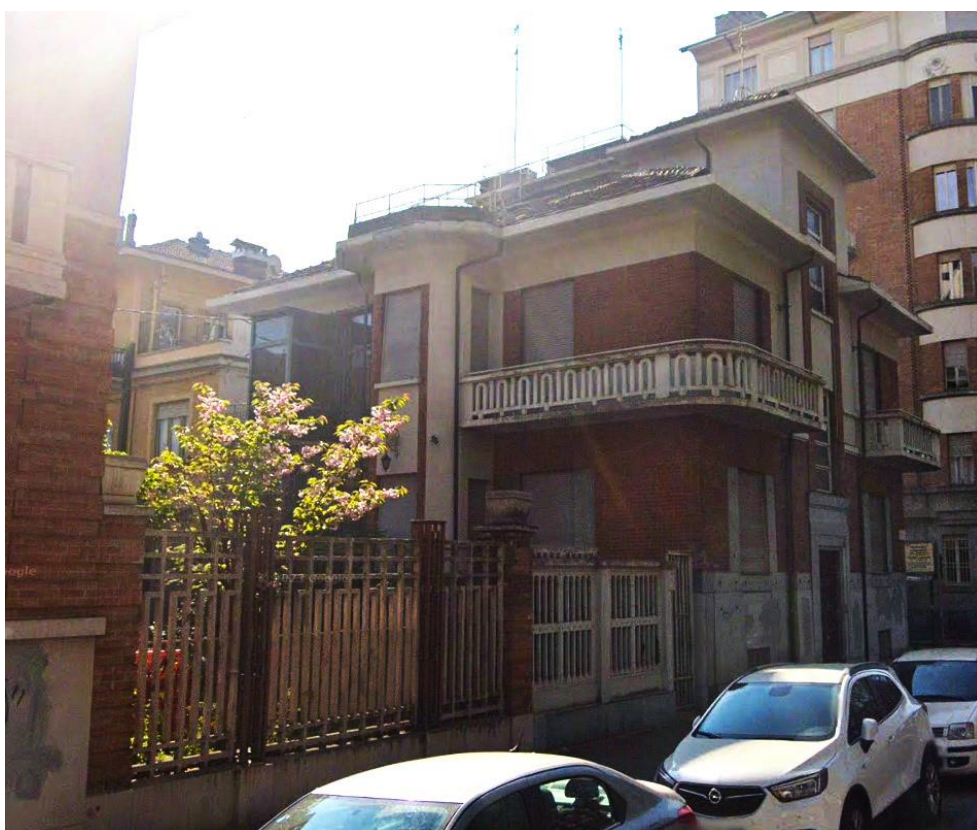
Prospetto nord - vista da Corso Tassoni