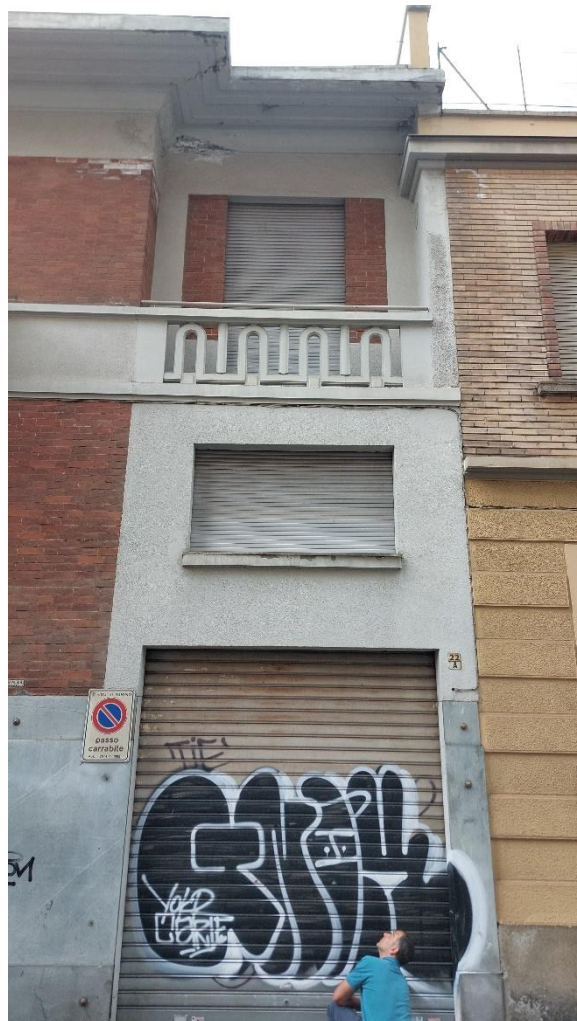
Prospetto sud – dettaglio ingresso carraio