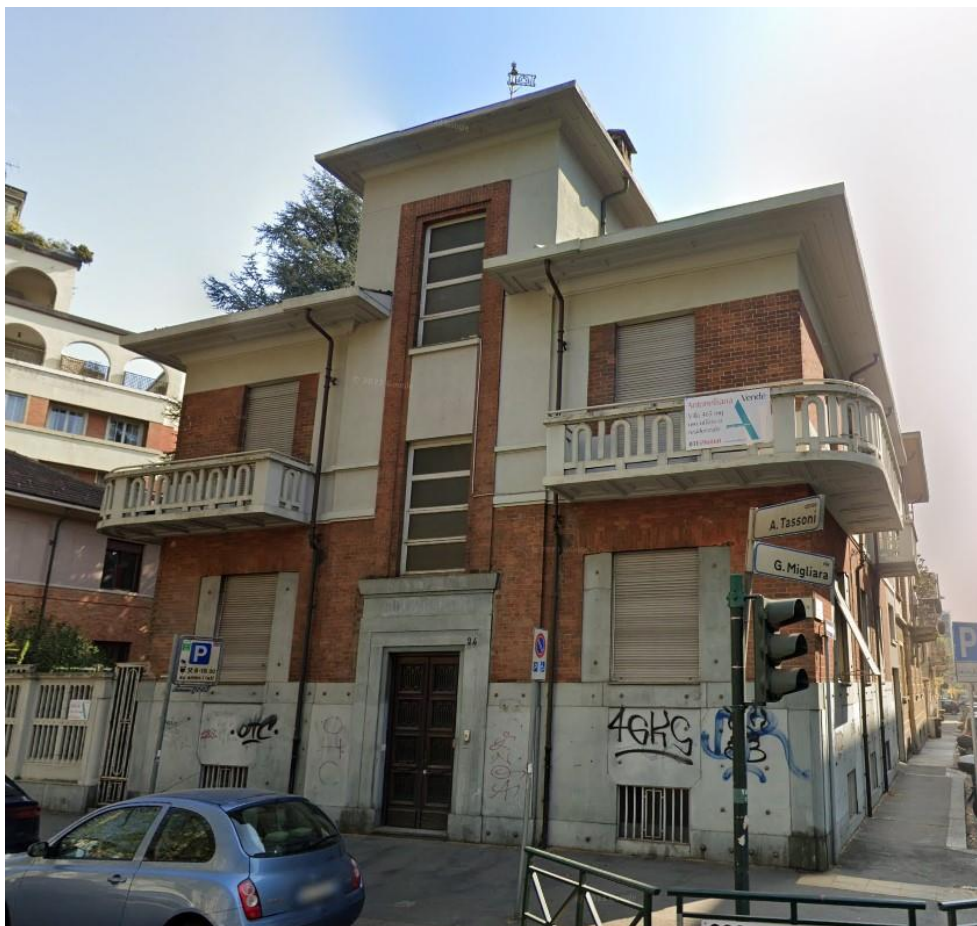
Ingresso dell'edificio - vista da Corso Tassoni angolo via Migliara