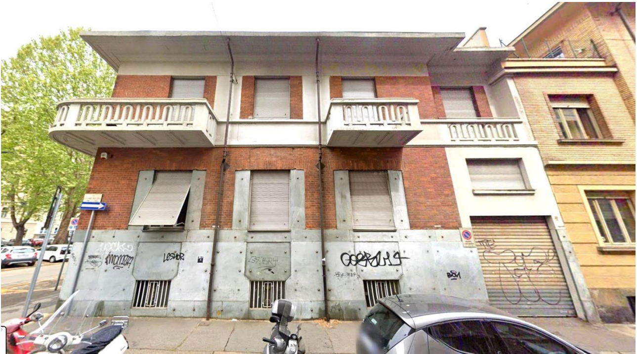
Prospetto sud - vista da via Migliara