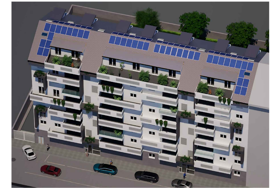
4. VISTA Lato Strada Via Trofarello