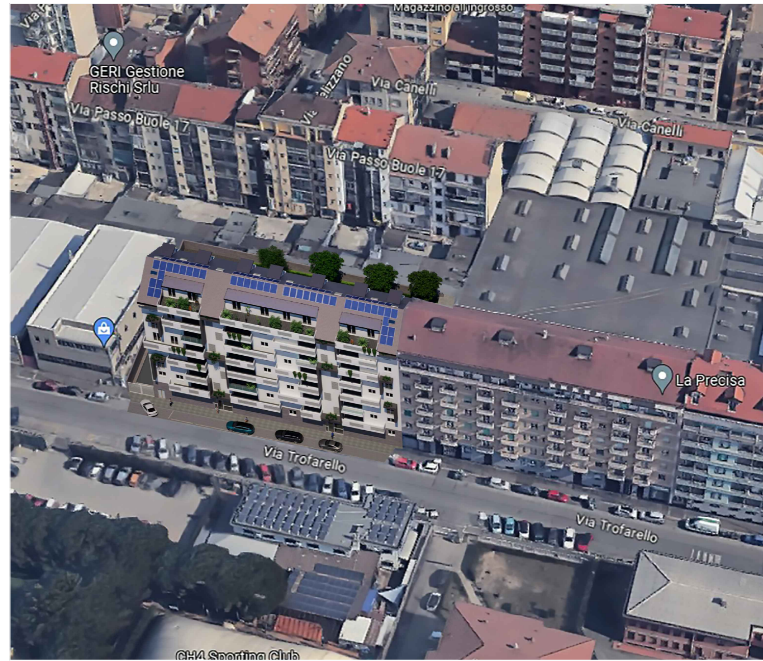
1. FOTOINSERIMENTO Vista Lato Strada Via Trofarello