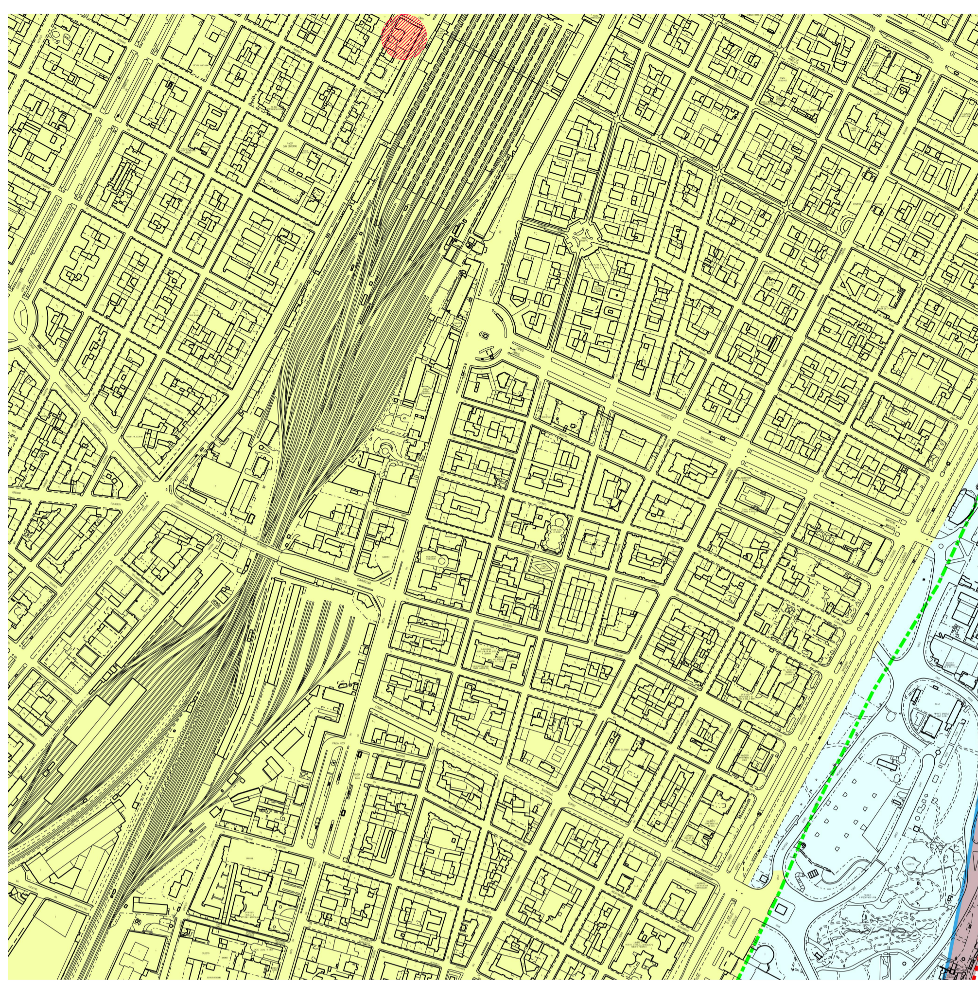
ESTRATTO PLANIMETRICO DI CARTA DI SINTESI DELLA PERICOLOSITÀ GEOMORFOLOGICA E DELL'IDONEITÀ ALL'UTILIZZAZIONE URBANISTICA Scala 1:5000 individuazione area oggetto di intervento