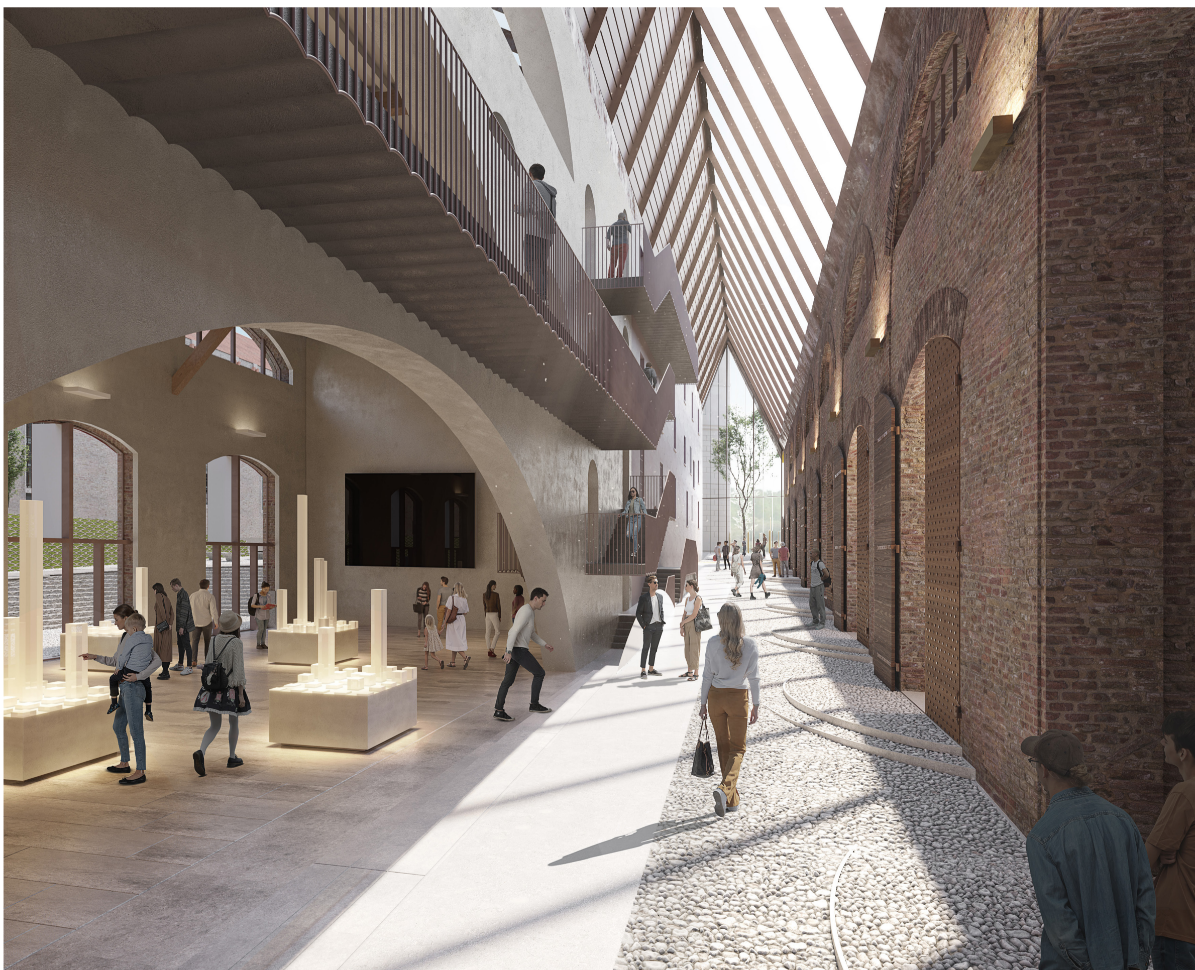
Veduta interna del nuovo passaggio coperto dell'Ala delle Pagliere.

Si riporta l'immagine del concorso perchè esemplificativa dei materiali scelti, per il disegno aggiornato della facciata si faccia riferimento all'elaborato 5175_02_OC_E005_21. La modifica consiste nella sostituzione degli elementi segnaletici con delle vetrate fisse sulla scala retrostante.