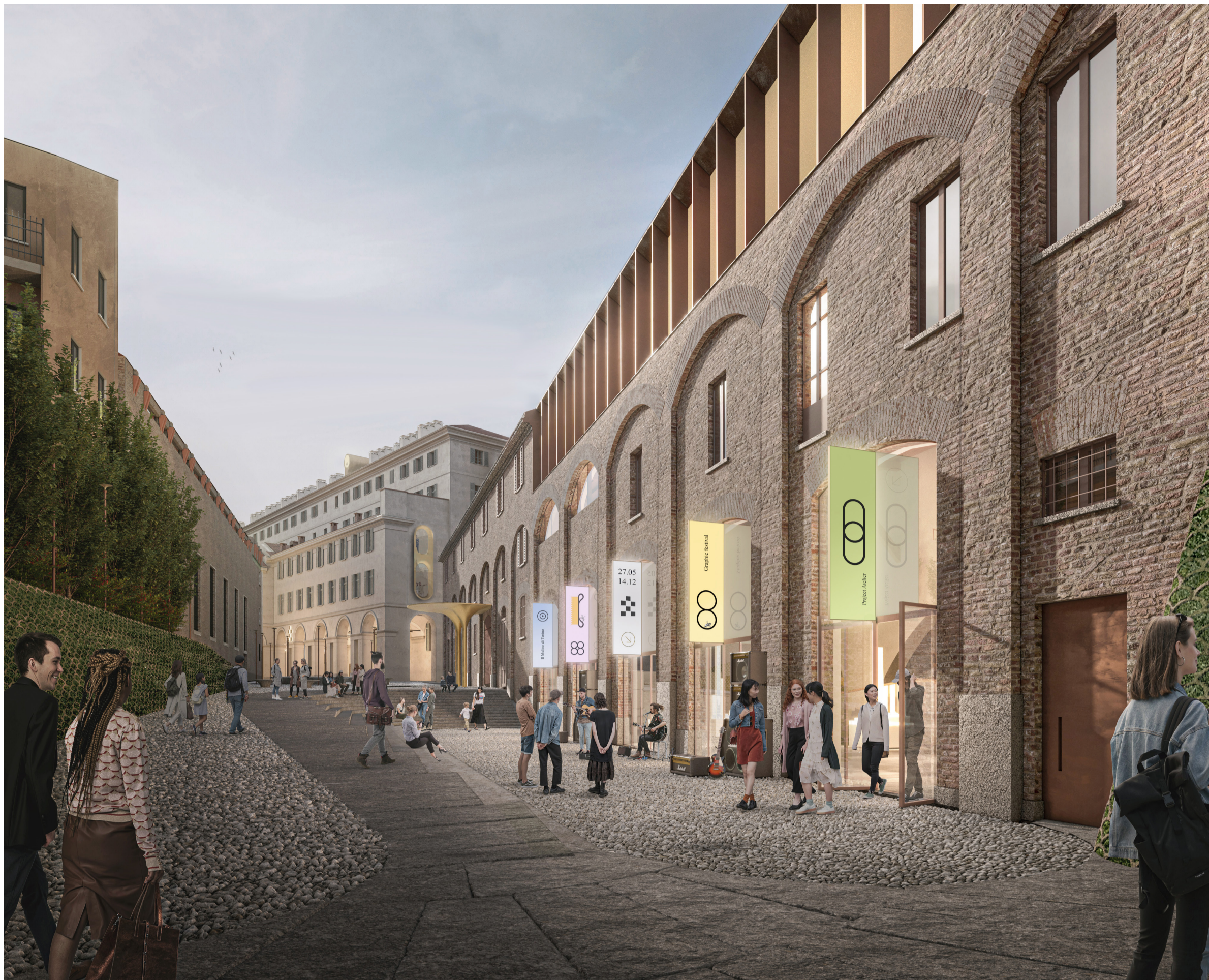
Veduta esterna del Passaggio Chiabrese fuori dall'Ala delle Pagliere.