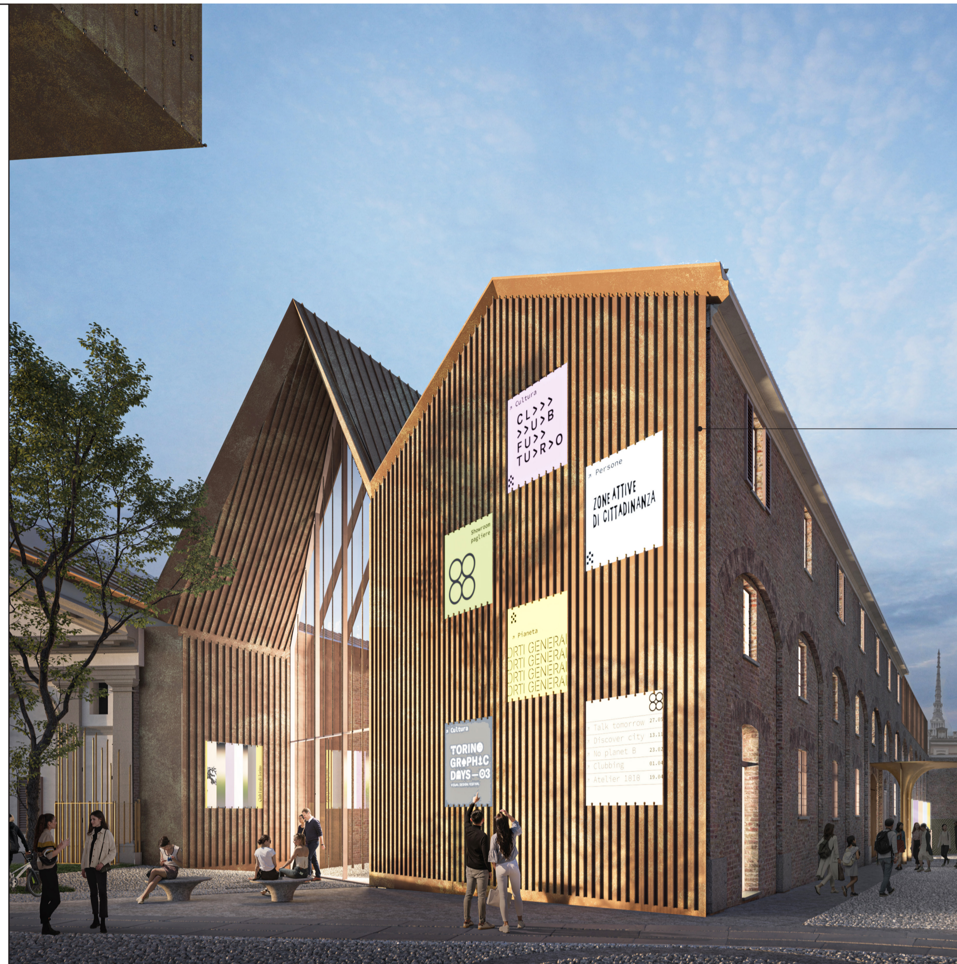
Veduta esterna della Piazza del Bagolaro con la facciata ovest dell'Ala delle Pagliere.

Si riporta l'immagine del concorso perchè esemplificativa dei materiali scelti, per il disegno aggiornato della facciata si faccia riferimento all'elaborato 5175_02_OC_E005_21. La modifica consiste nella sostituzione degli elementi segnaletici con delle vetrate fisse sulla scala retrostante.