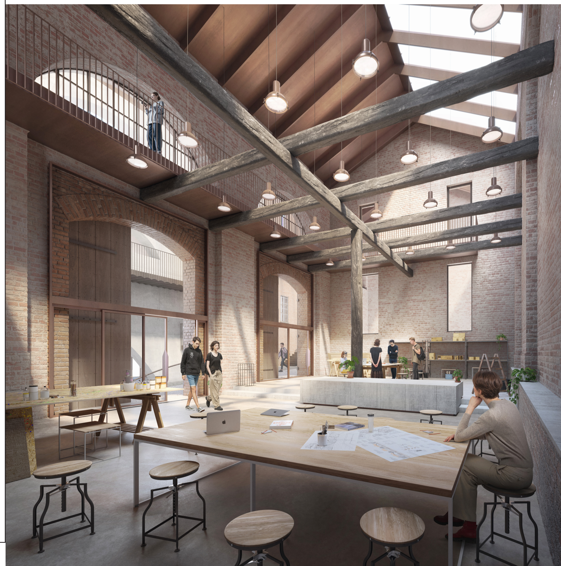
Veduta interna di una serra progettuale al piano terra dell'Ala delle P

COMMITTENTE: Fondazione Compagnia di San Paolo CAVALLERIZZA REALE DI TORINO ALA DEL MOSCA (UM15), PAGLIERE (UM10), PIAZZETTA VASCO E PASSAGGIO CHIABLESE (UM11) VIA VERDI 7 - 9 E VIA ROSSINI 11, TORINO PROGETTO DEFINITIVO