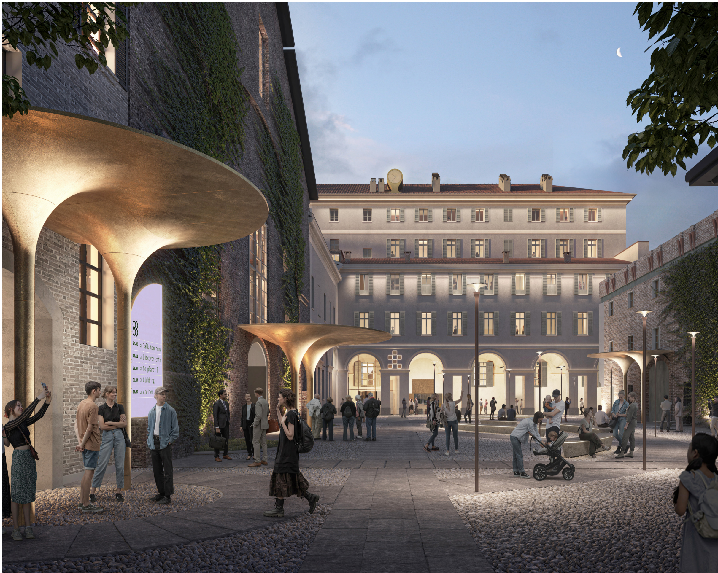
Veduta esterna della Piazzetta Fratelli Vasco con la facciata sud dell'Ala del Mosca.