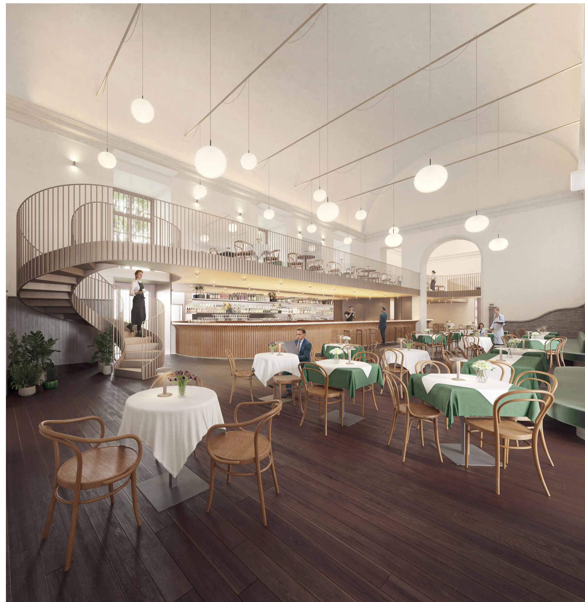
Veduta interna della caffetteria al piano terra dell'Ala del Mosca.

COMMITTENTE: Fondazione Compagnia di San Paolo CAVALLERIZZA REALE DI TORINO ALA DEL MOSCA (UMI5), PAGLIERE (UMI10), PIAZZETTA VASCO E PASSAGGIO CHIALESE (UMI11) VIA VERDI 7 - 9 E VIA ROSSINI 11, TORINO PROGETTO DEFINITIVO