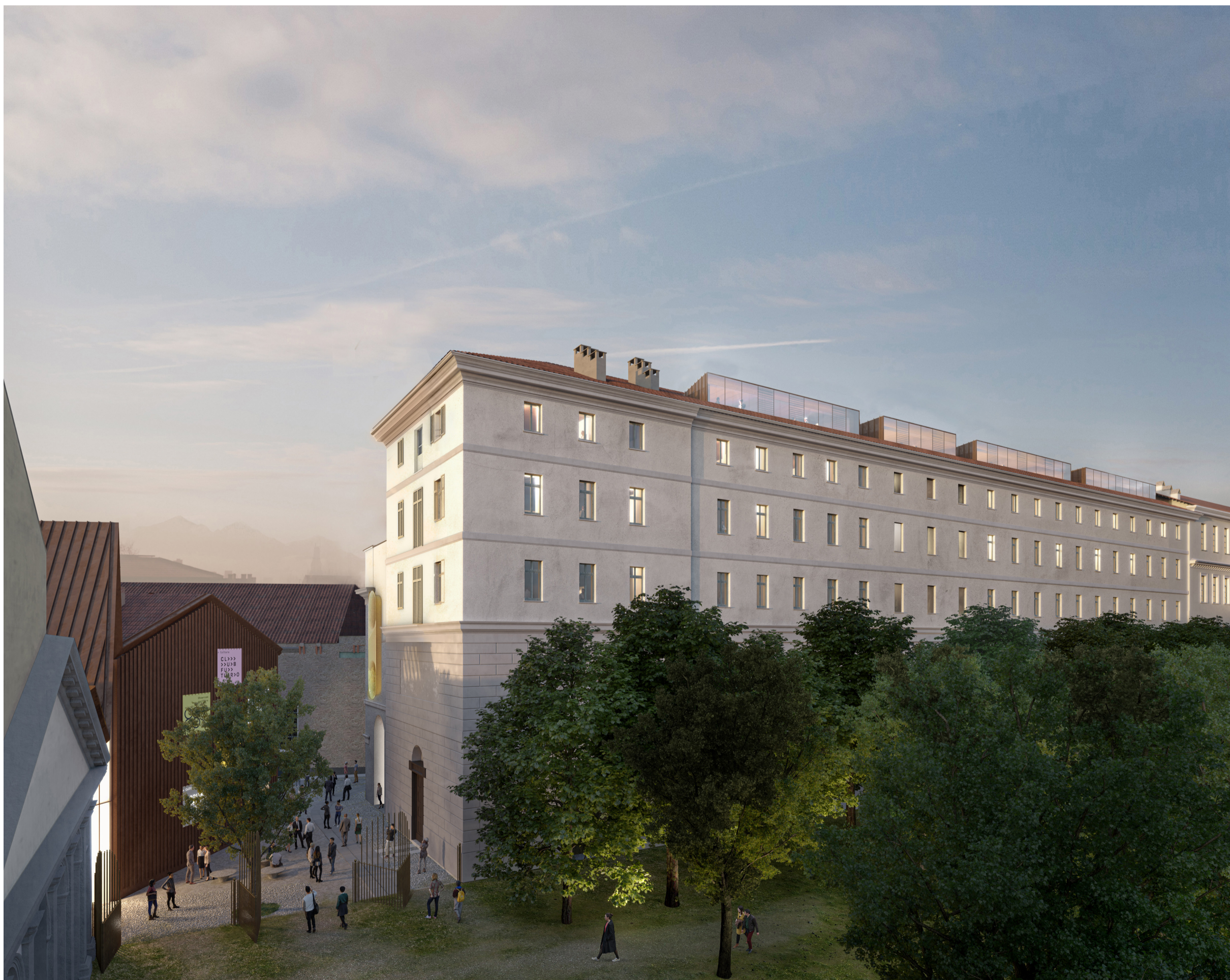
Veduta esterna del Parco con le facciate nord e est dell'Ala del Mosca e facciata ovest dell'Ala delle Pagliere.

Nell'immagine manca una partizione vetrata che separa l'atrio e la reception dal portico. Questa separazione è stata espressamente richiesta dal Comando dei Vigili del Fuoco nel merito del progetto di prevenzione incendi. (Riferimento tavola: 5175_01_OC_D003_20)