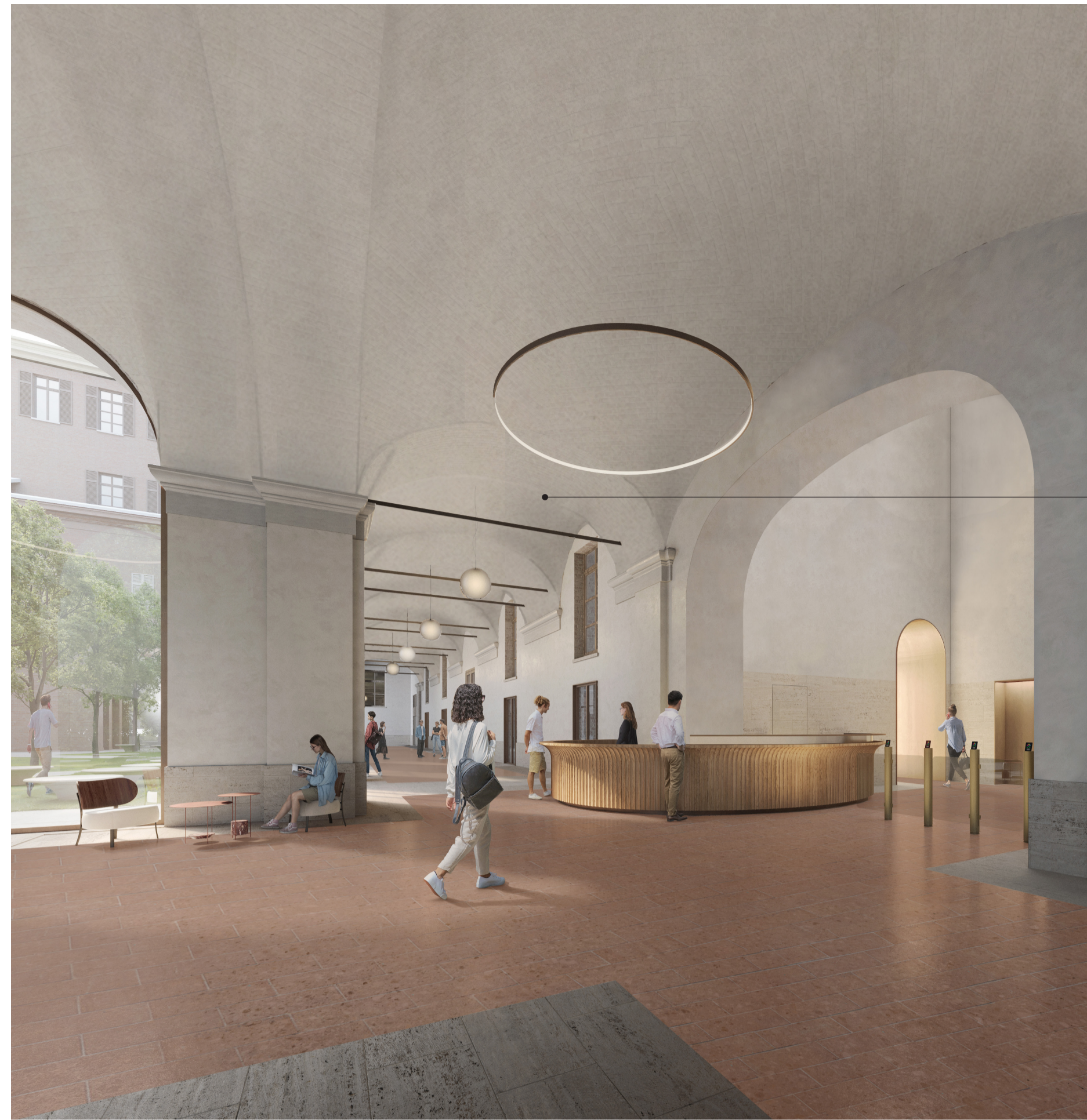
Veduta interna dell'atrio e del portico al piano terra dell'Ala del Mosca.

Nell'immagine manca una partizione vetrata che separa l'atrio e la reception dal portico. Questa separazione è stata espressamente richiesta dal Comando dei Vigili del Fuoco nel merito del progetto di prevenzione incendi. (Riferimento tavola: 5175_01_OC_D003_20)