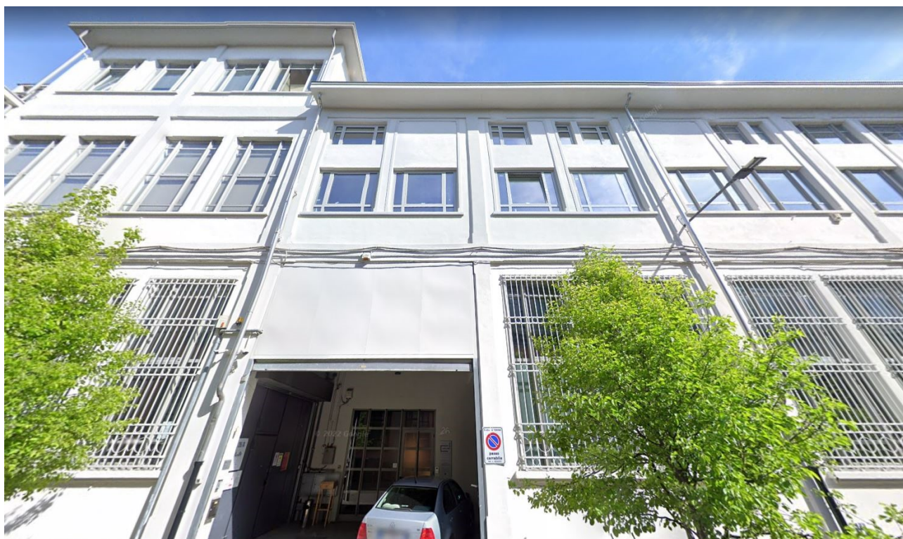
Vista esterna del complesso in Via Cervino n. 28/a

OGGETTO: Documentazione Fotografica – Esterno e interni