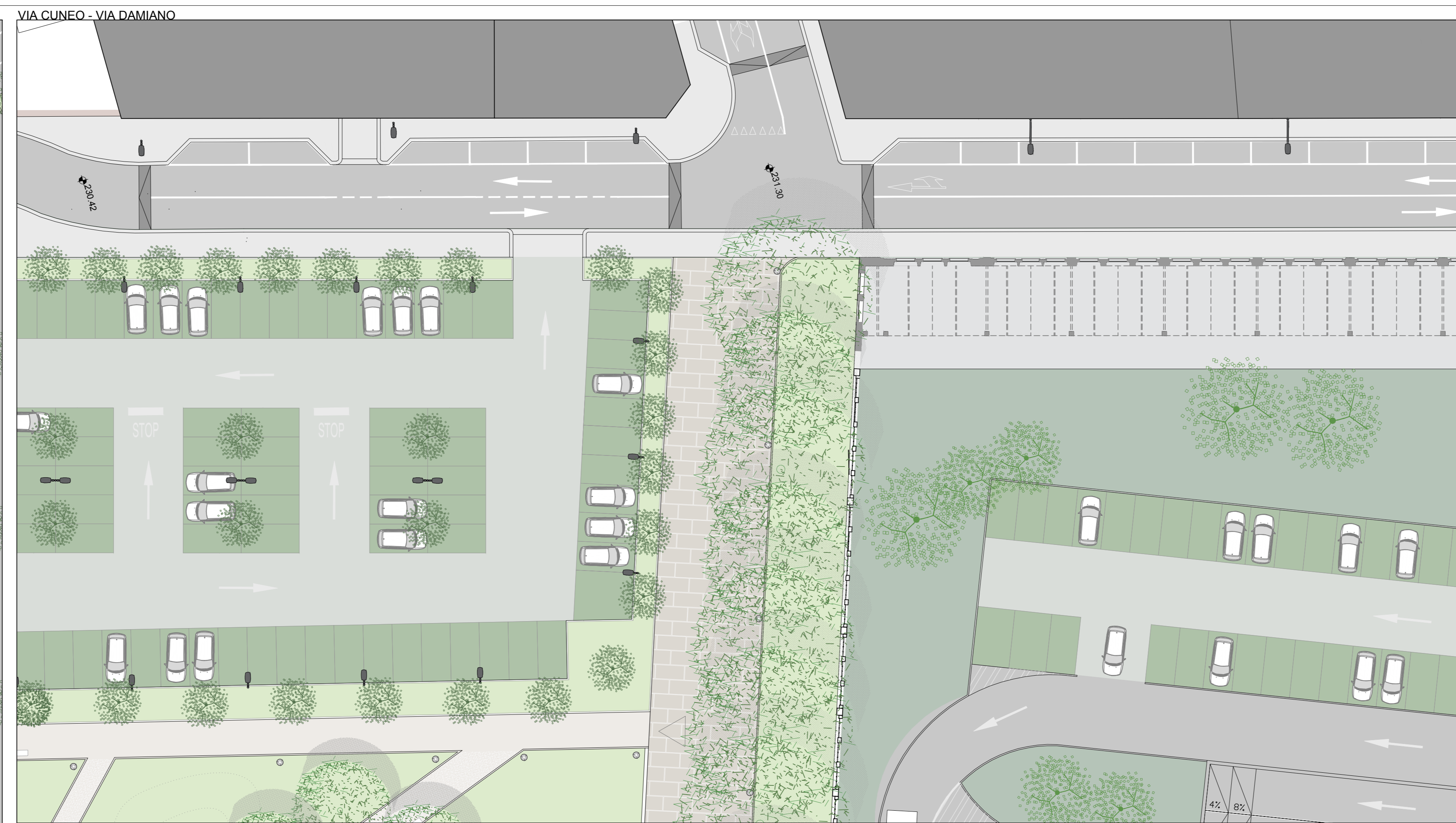
VIA CUNEO - VIA DAMIANO