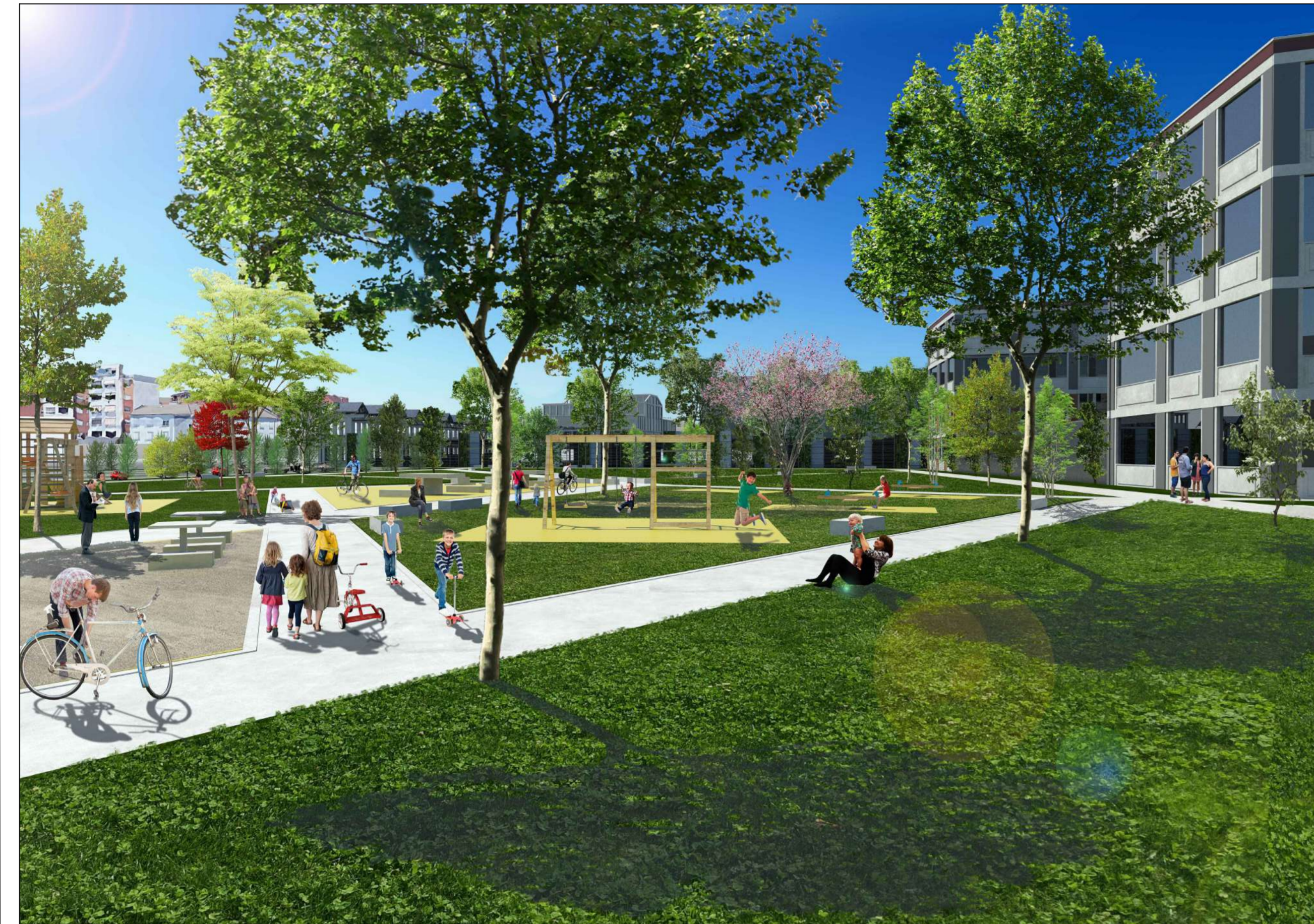
RENDER FOTOREALISTICO DEL PARCO PUBBLICO IN PROGETTO - v089 1