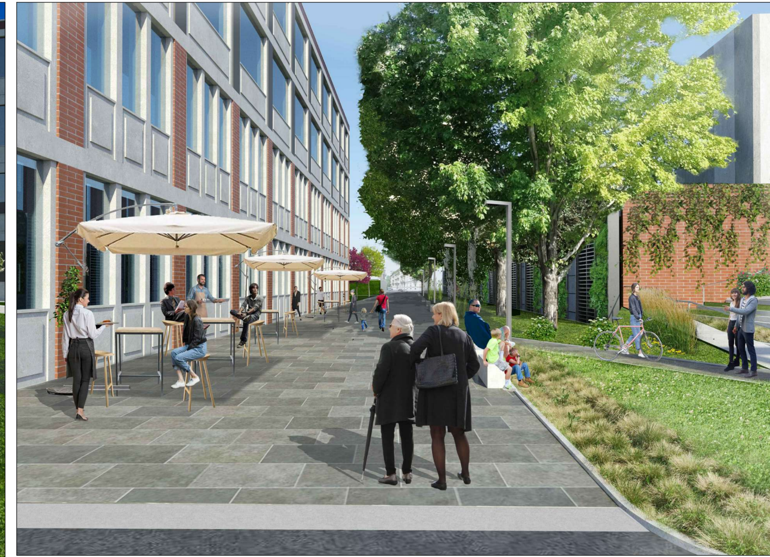
RENDER FOTOREALISTICO DELLA NUOVA VIA CUNEO PEDONALE - v089 2