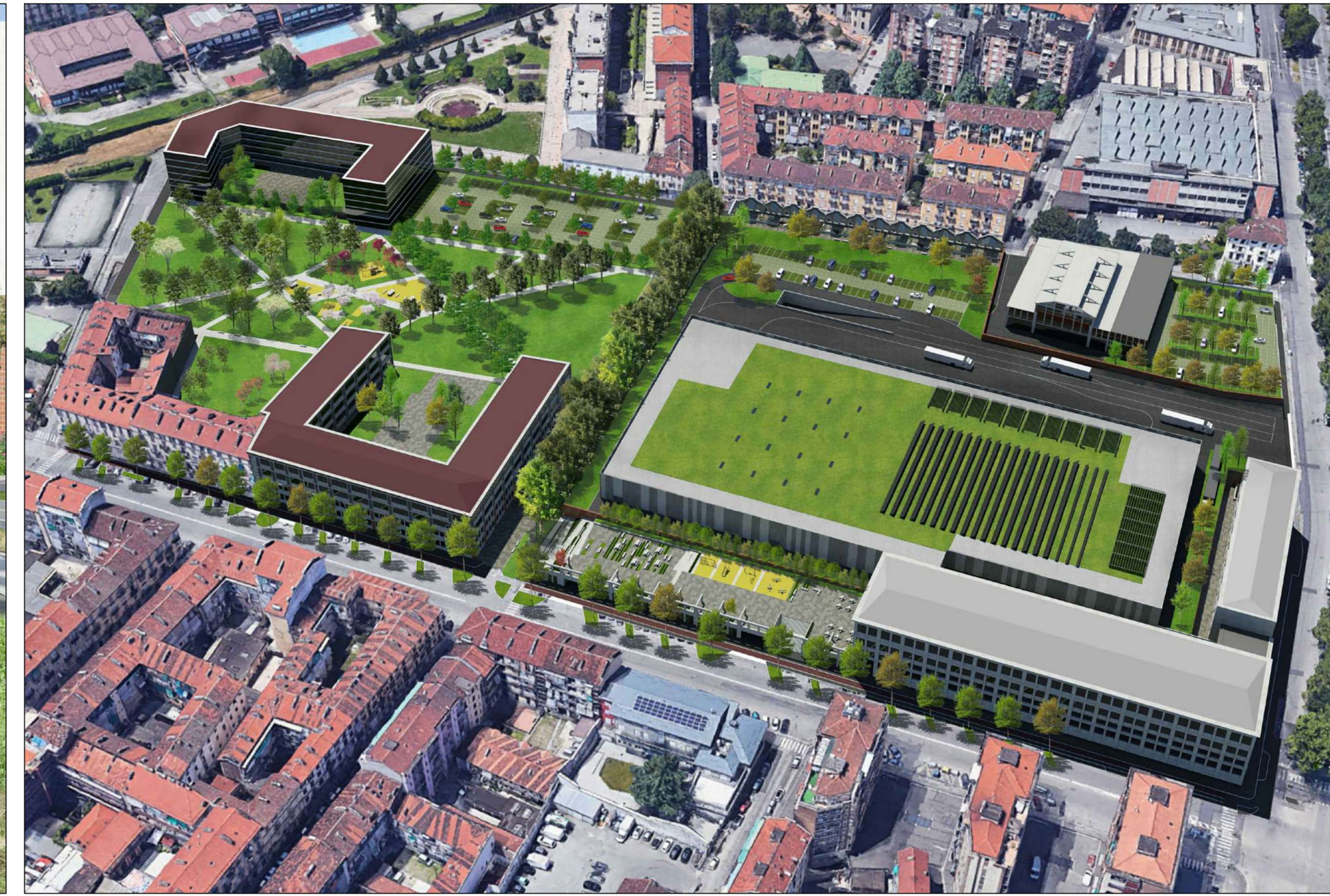
FOTOINSERIMENTO A VOLO D'UCCELLO DEL MASTERPLAN DI PROGETTO DELL'AREA DI INTERVENTO - v089 3