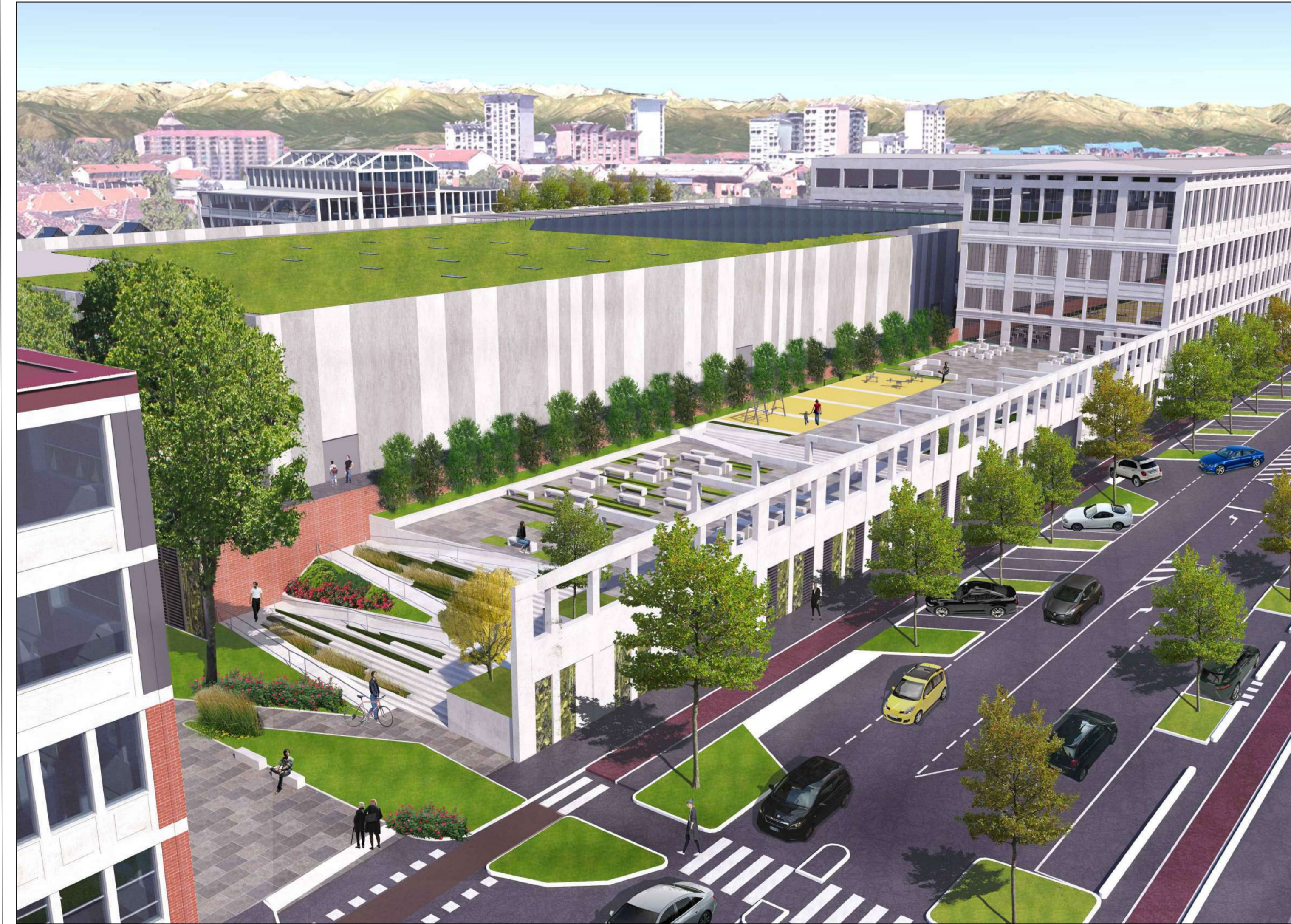
FOTOINSERIMENTO DELLA NUOVA TERRAZZA PUBBLICA SU CORSO VERCELLI - v089 4