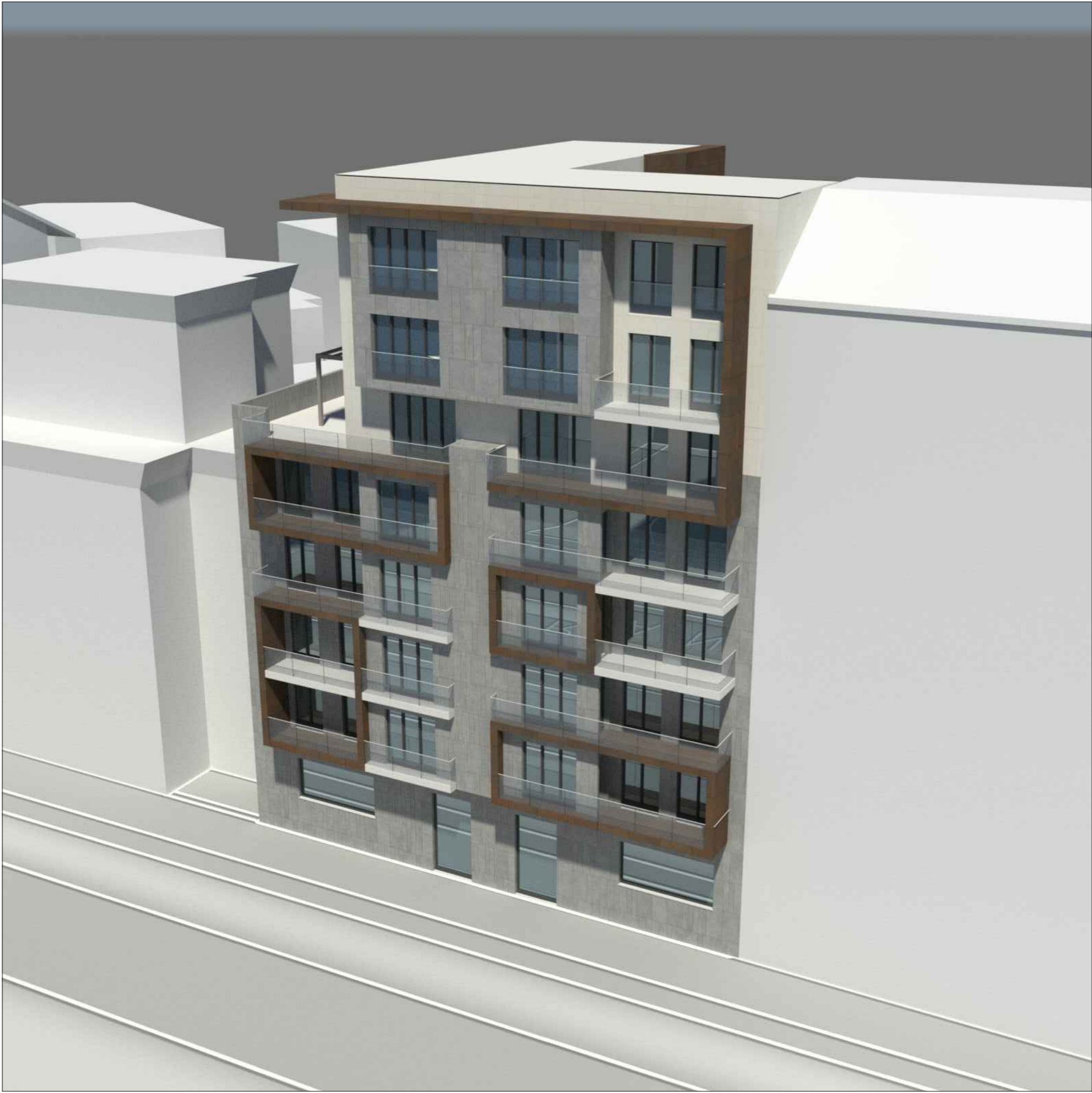
VISTA CORSO FRANCIA