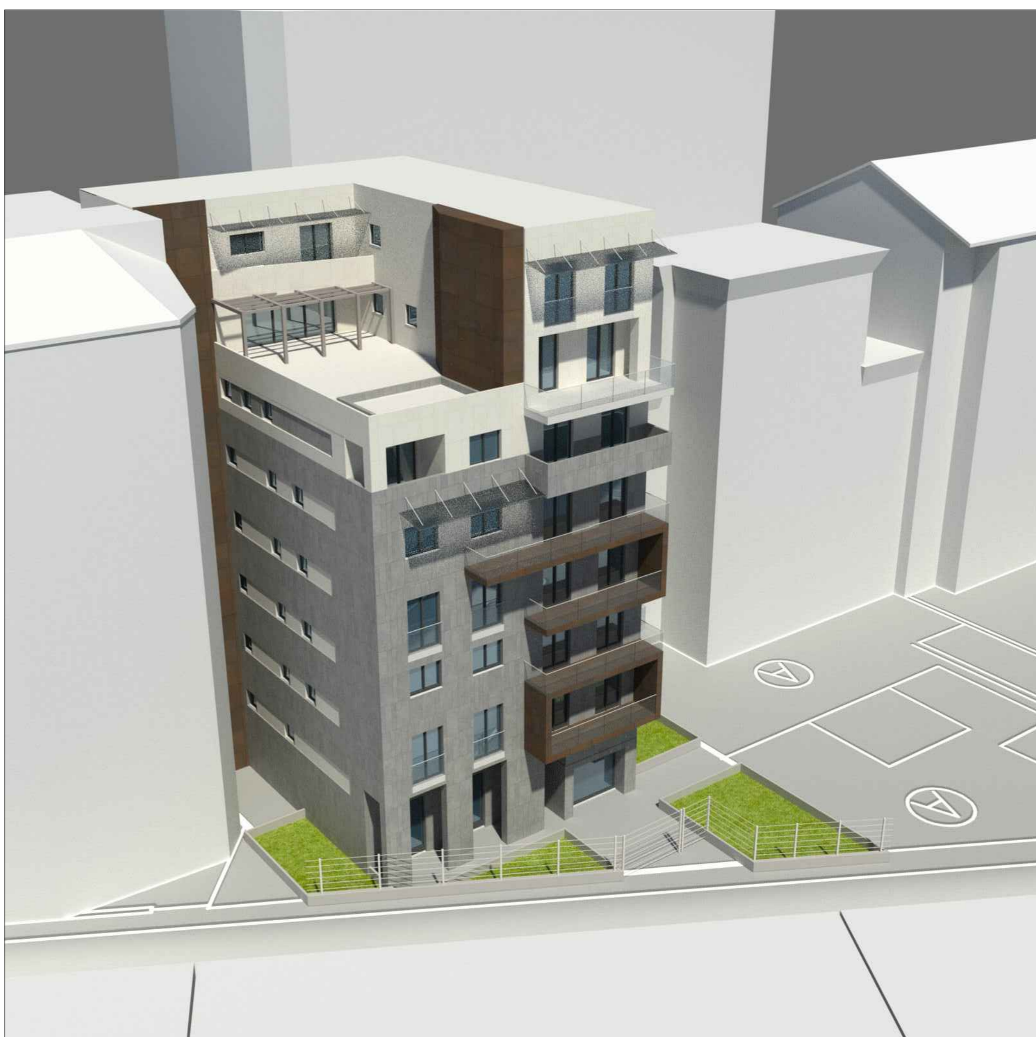
VISTA VIA DUCHESSA JOLANDA