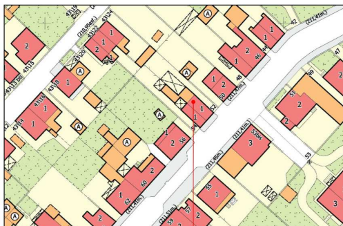
CARTA TECNICA – SCALA 1:1000