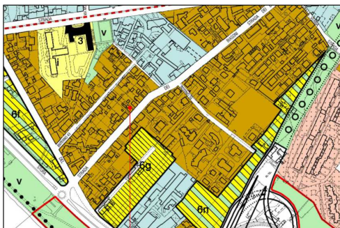
ESTRATTO DI PRGC – SCALA 1:5000