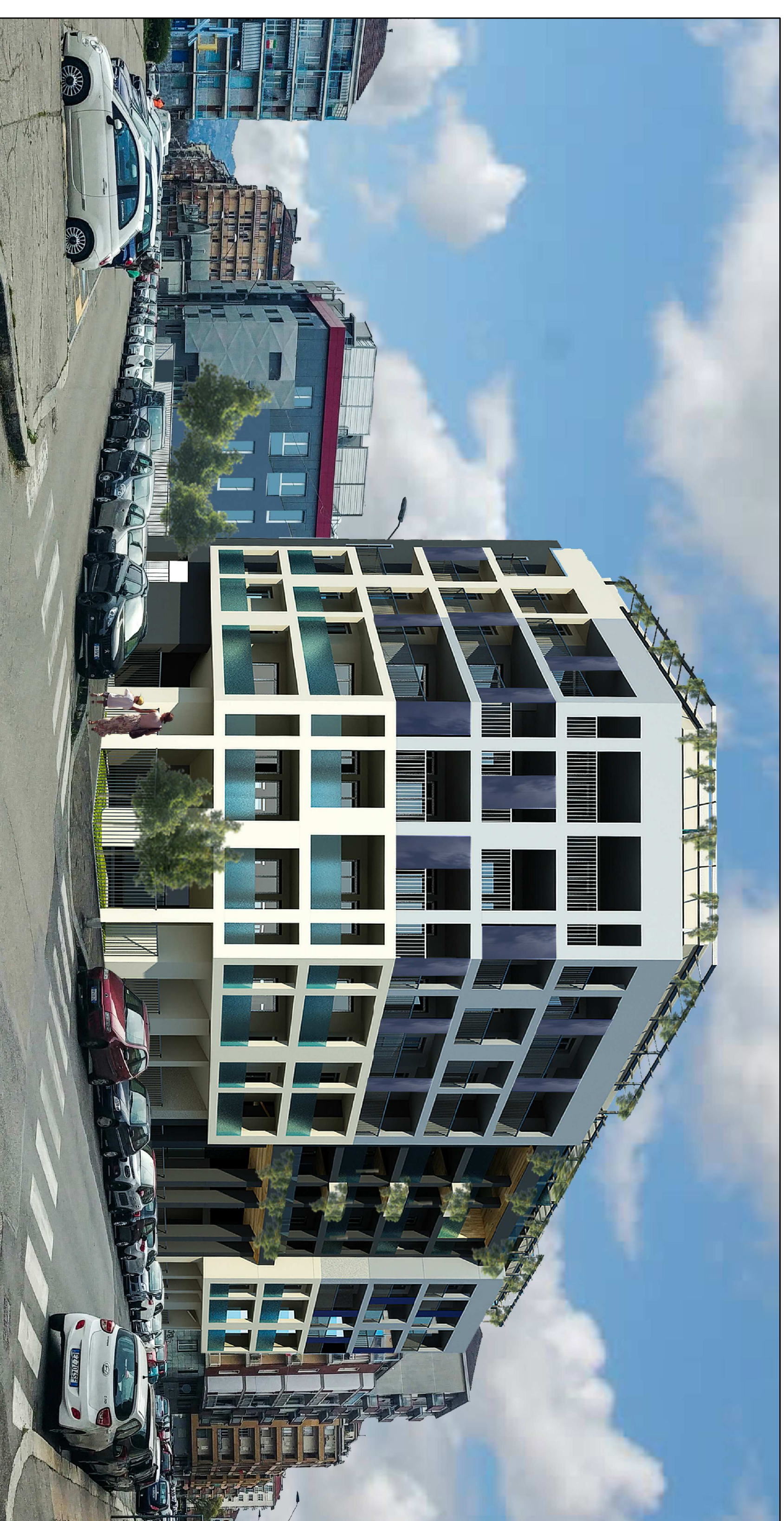
RENDER INSERIMENTO AMBIENTALE VIA ROVERETO ang VIA MOMBASIGLIO