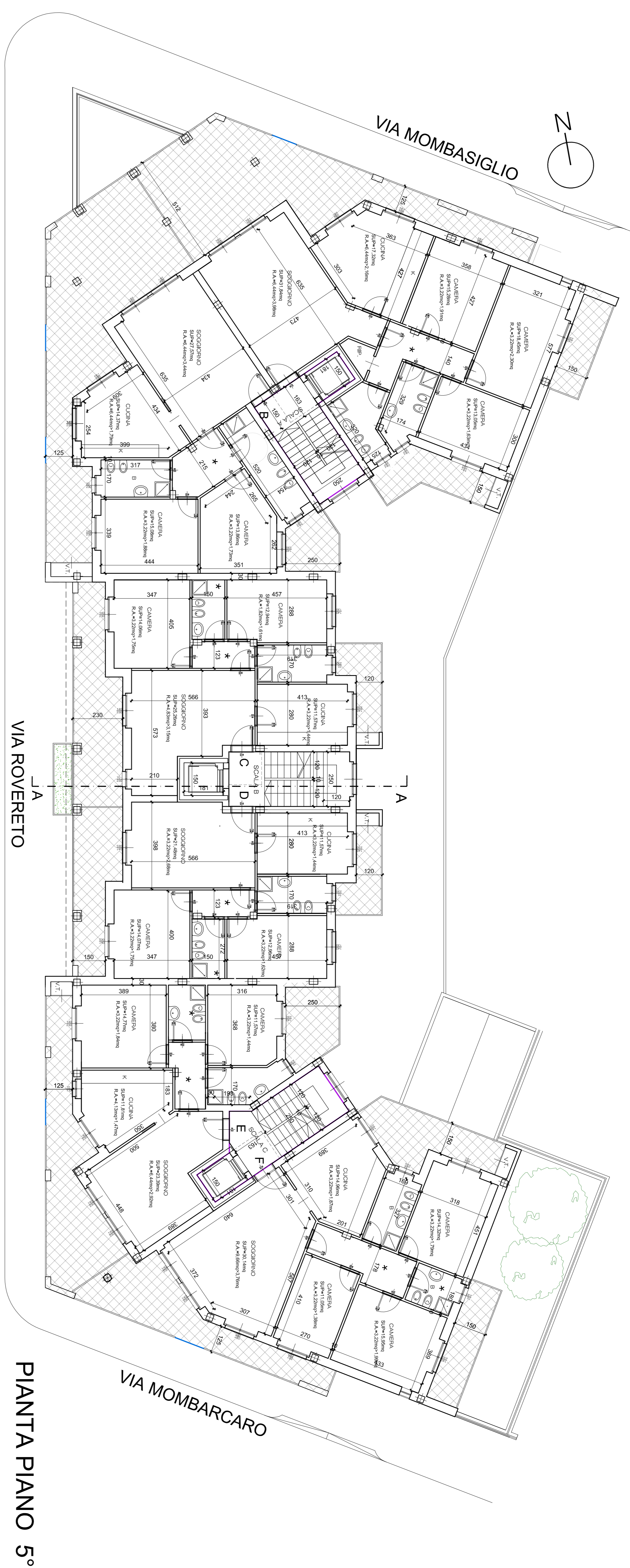
PIANTA PIANO 5°