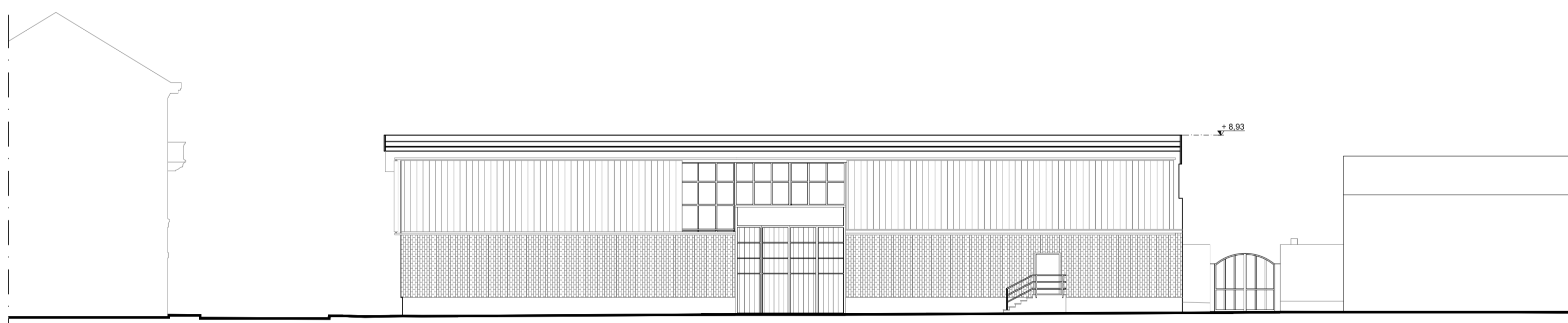
Prospetto Est scala 1:200