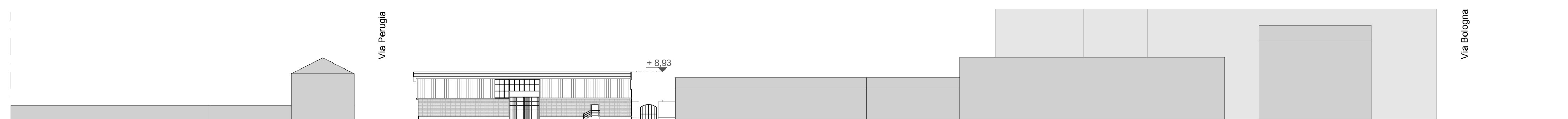
Prospetto Territoriale Est scala 1:500