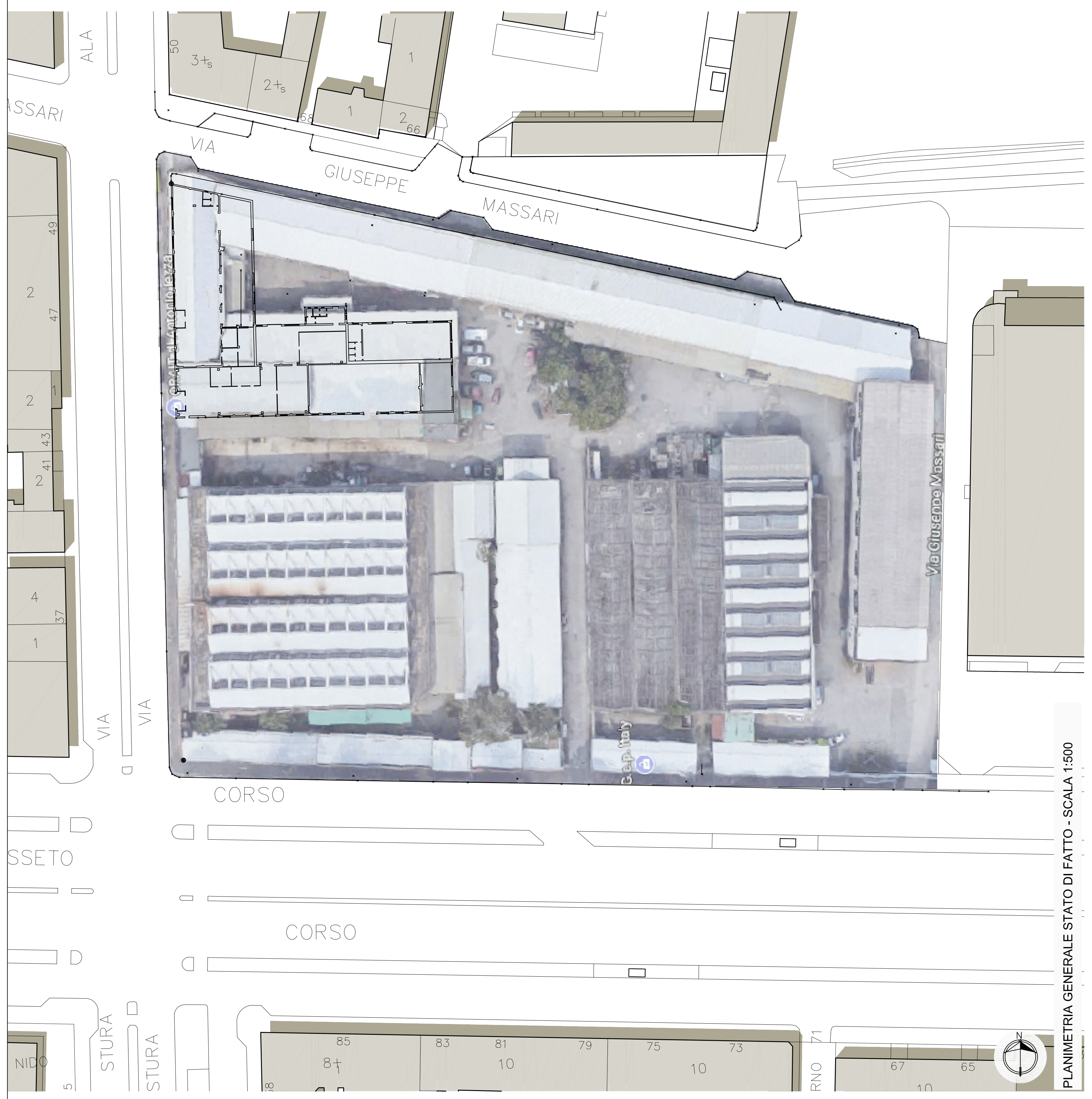
PLANIMETRIA GENERALE STATO DI FATTO - SCALA 1:500