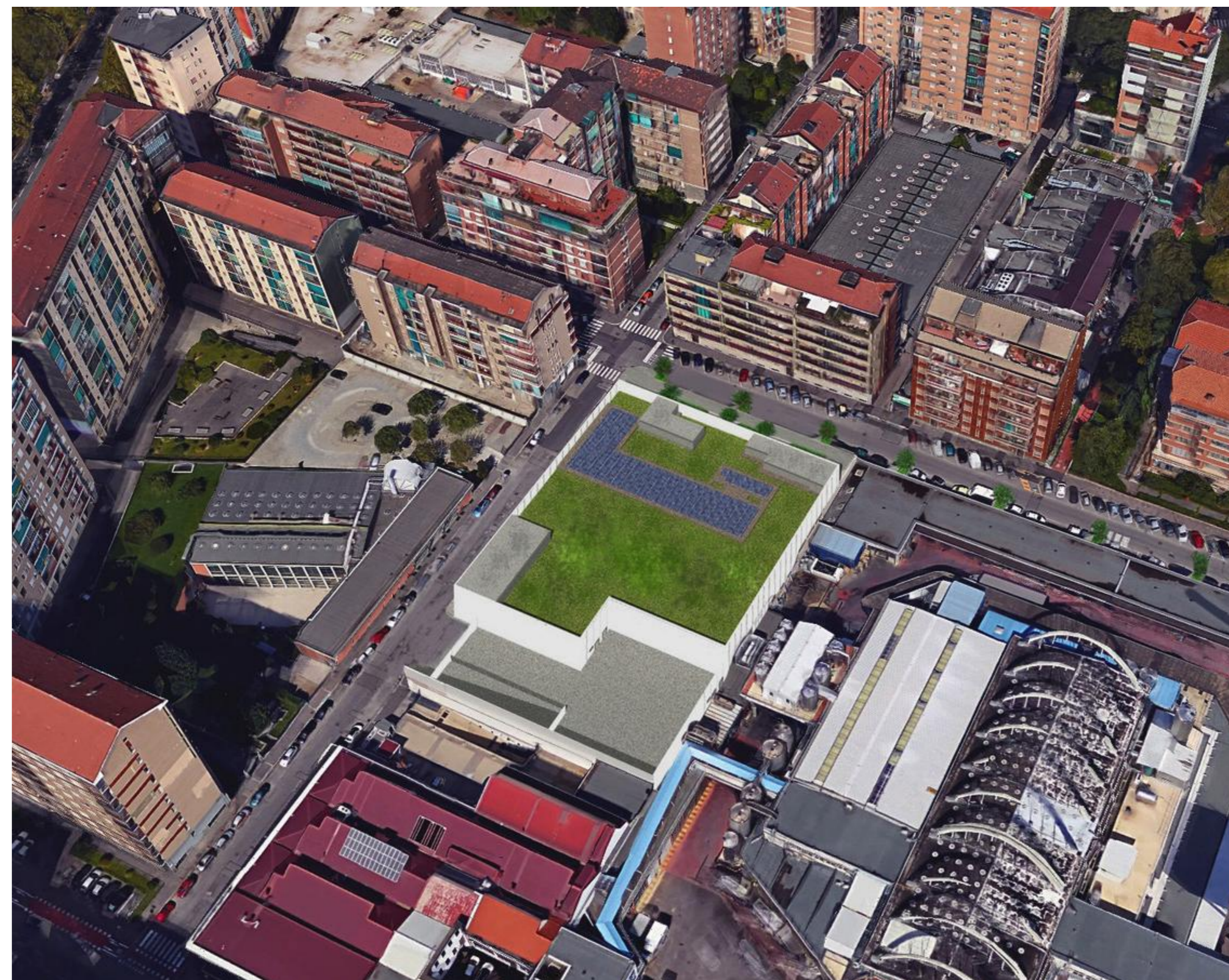
VISTA PROSPETTICA DI INSERIMENTO AMBIENTALE DALL'ALTO