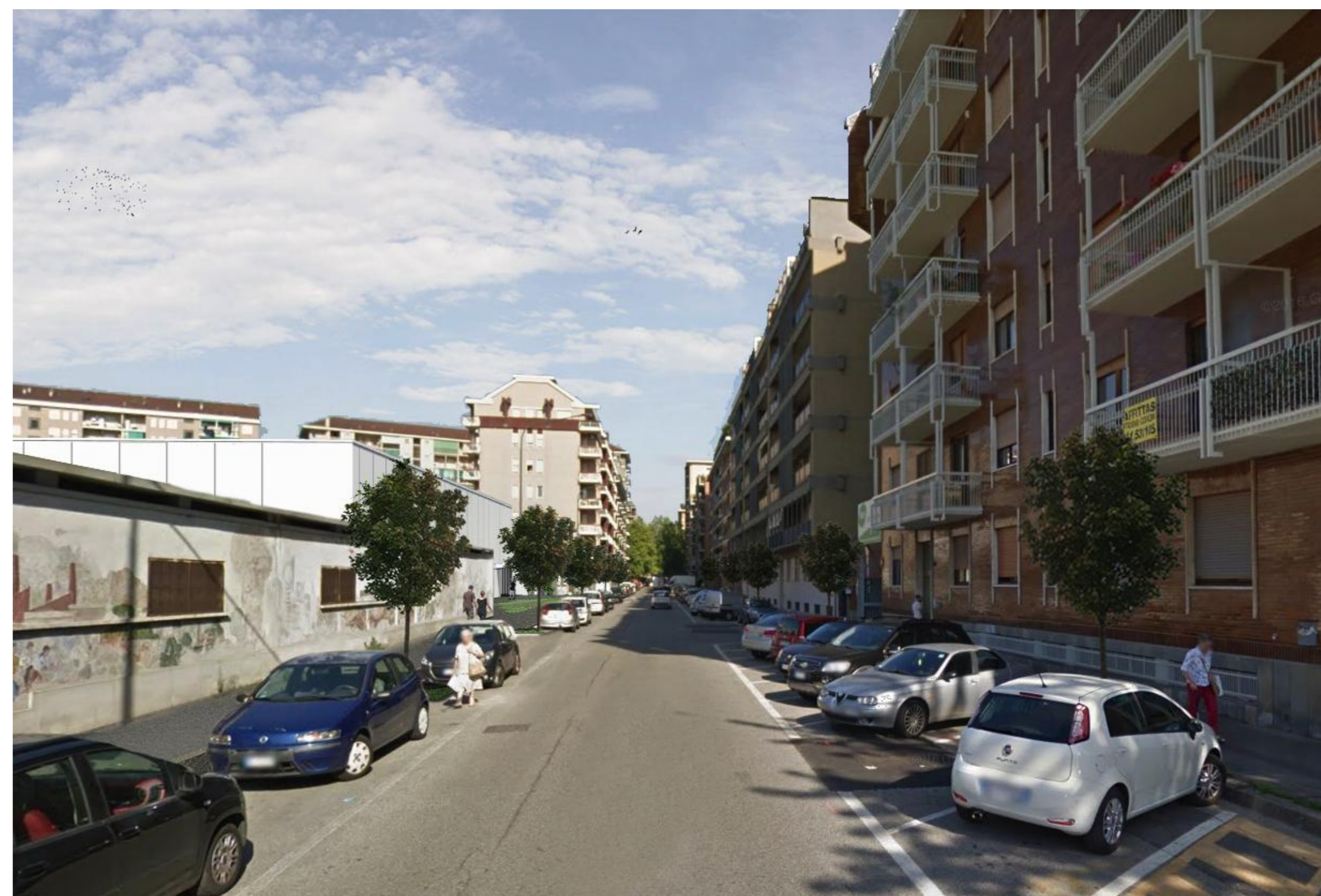
VISTA PROSPETTICA DI INSERIMENTO AMBIENTALE_3