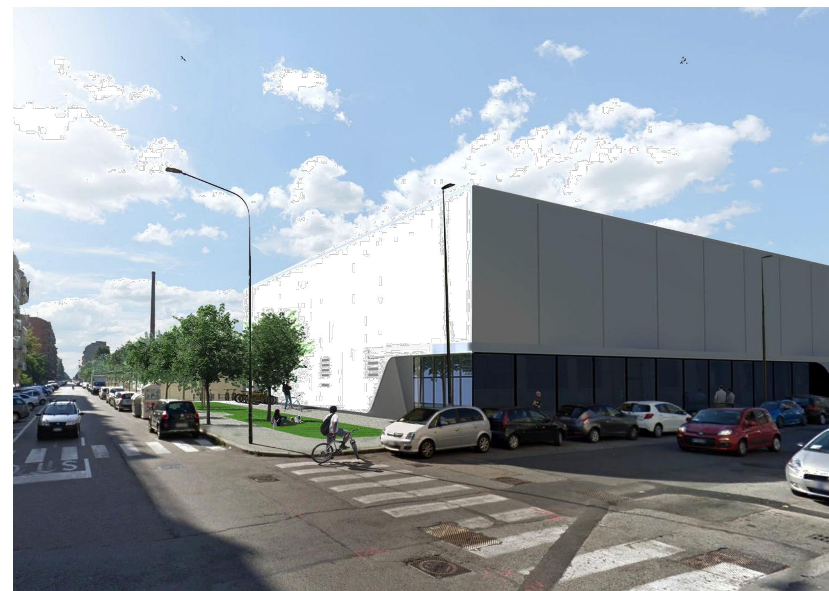
VISTA PROSPETTICA DI INSERIMENTO AMBIENTALE_1