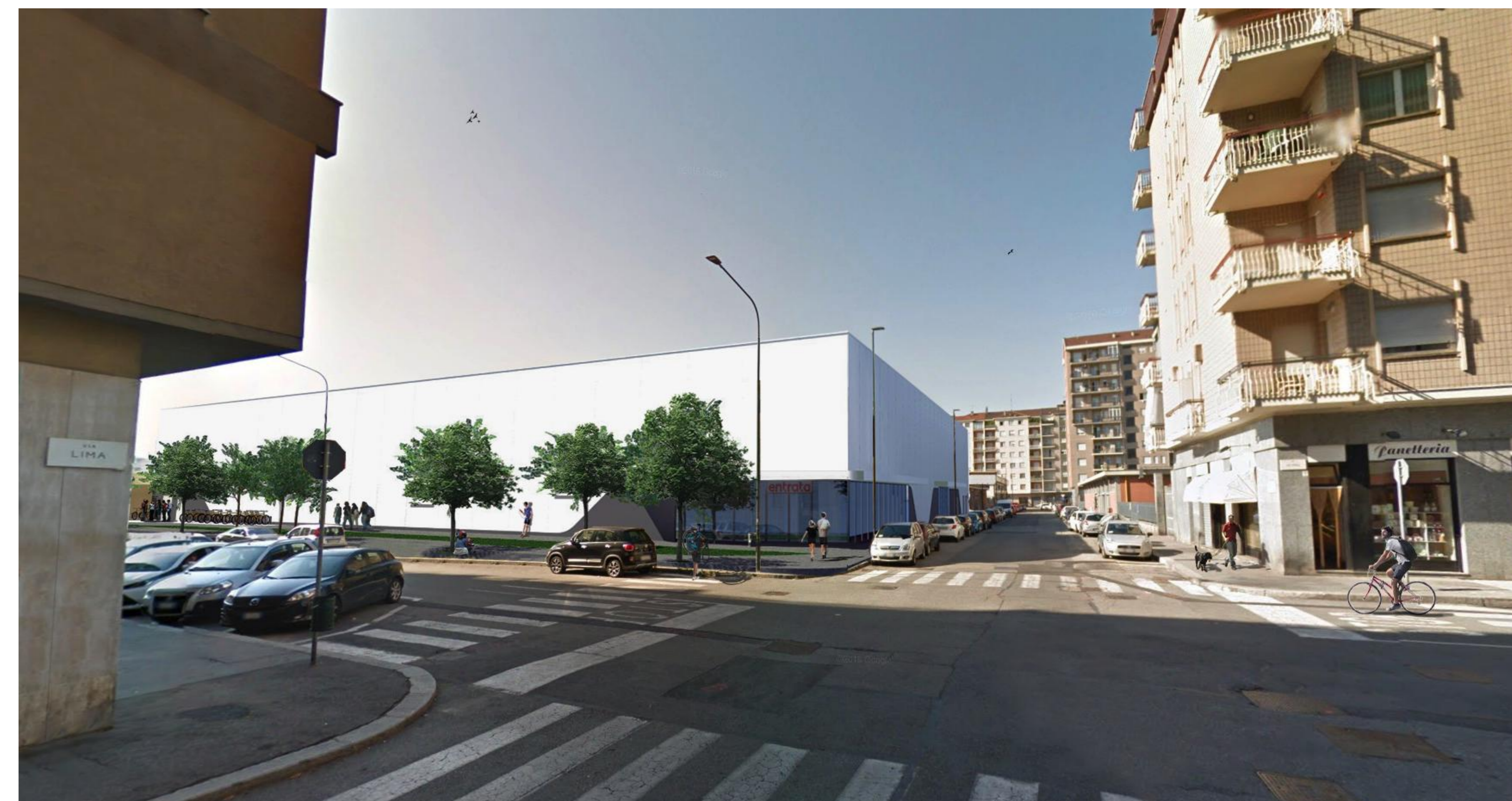
VISTA PROSPETTICA DI INSERIMENTO AMBIENTALE_2