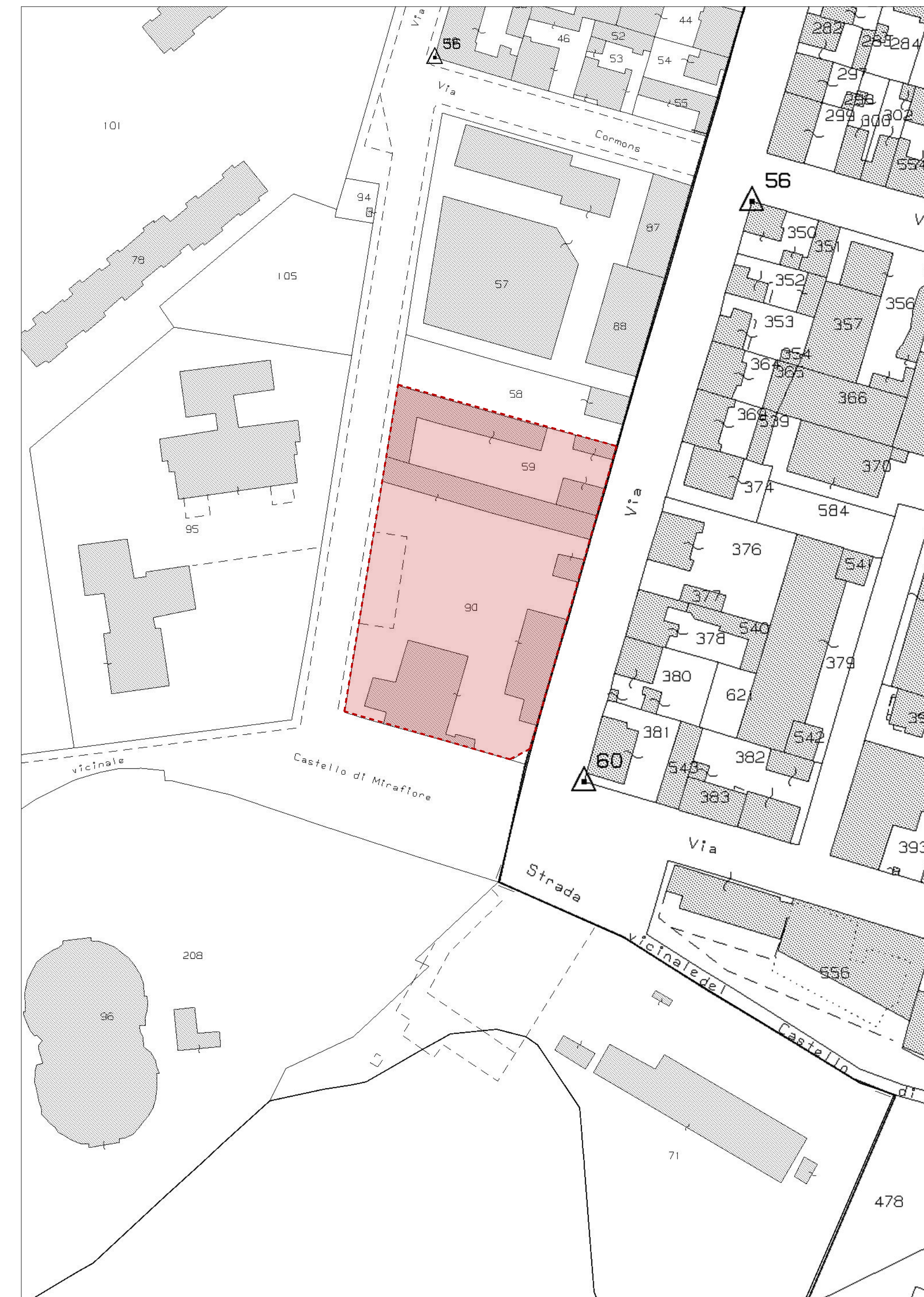
STRALCIO DI MAPPA CATASTALE - Foglio.1488, Part.90 e Part. 59