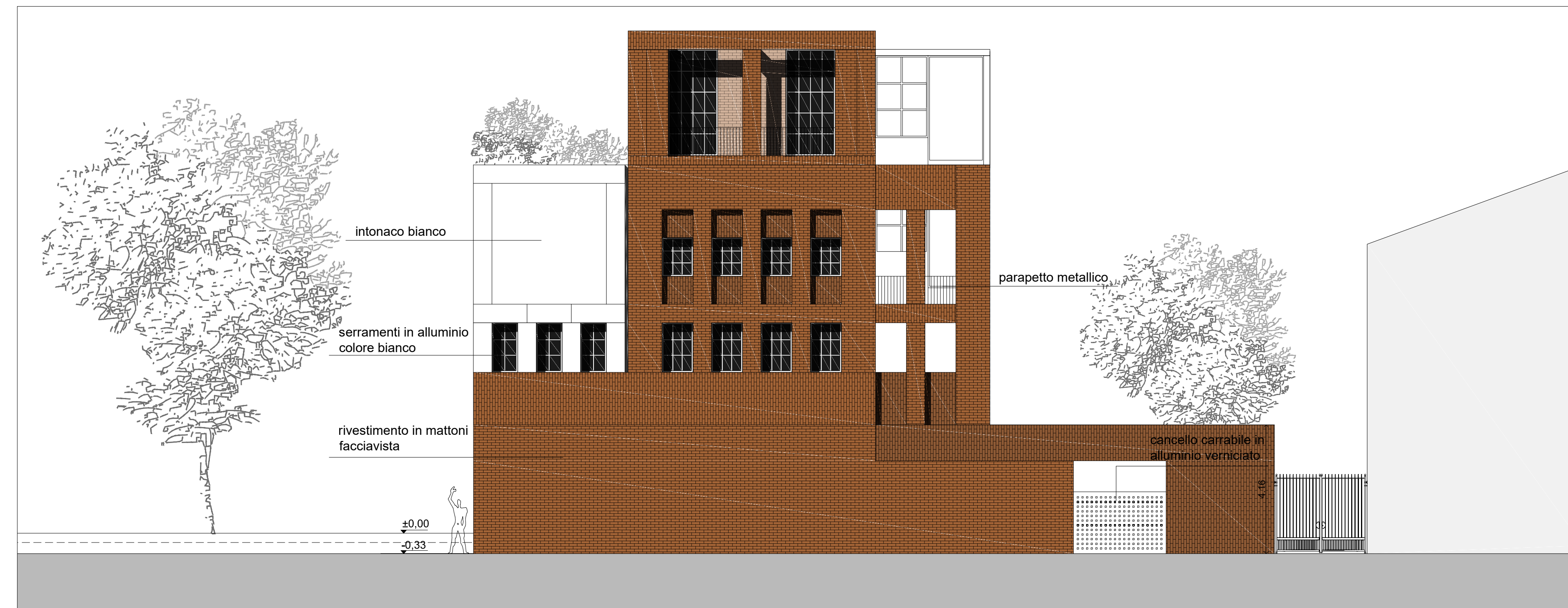
PROSPETTO SU VIA CATANIA