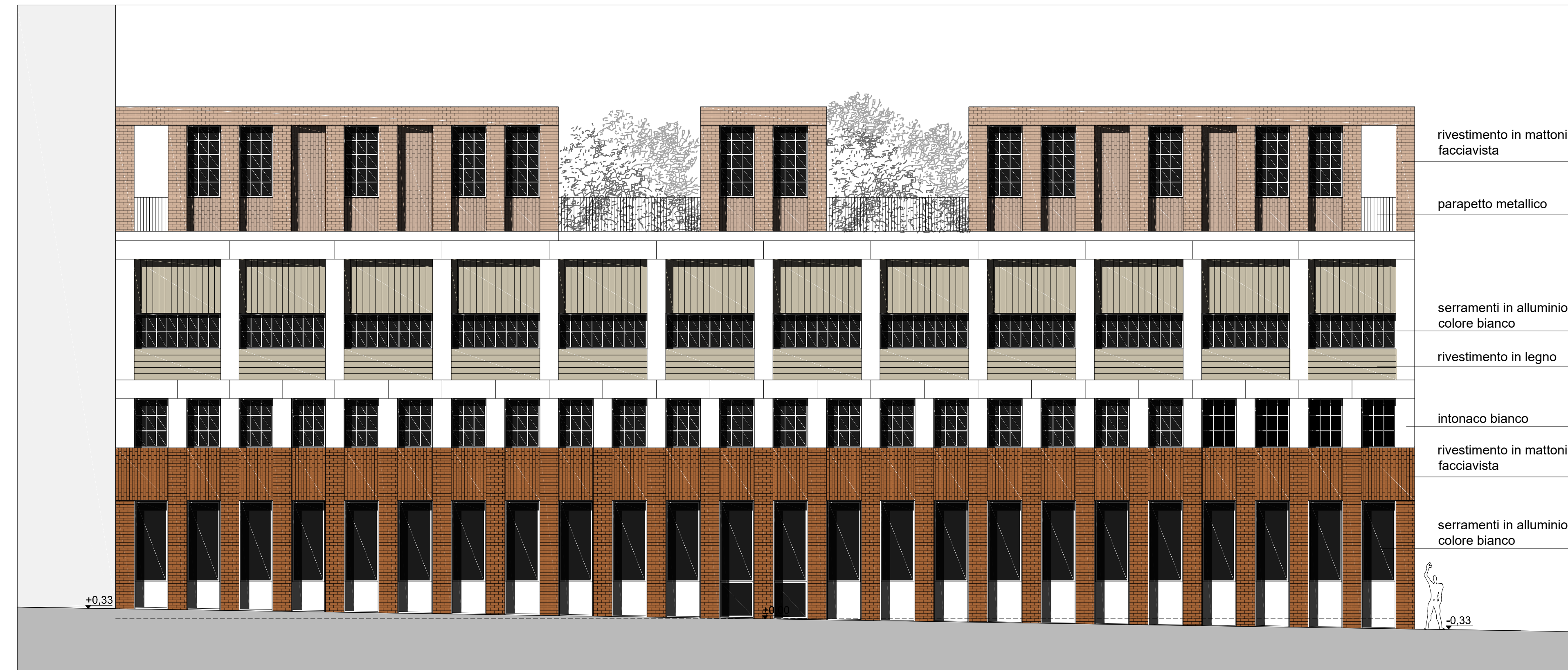
PROSPETTO SUL CORSO VERONA