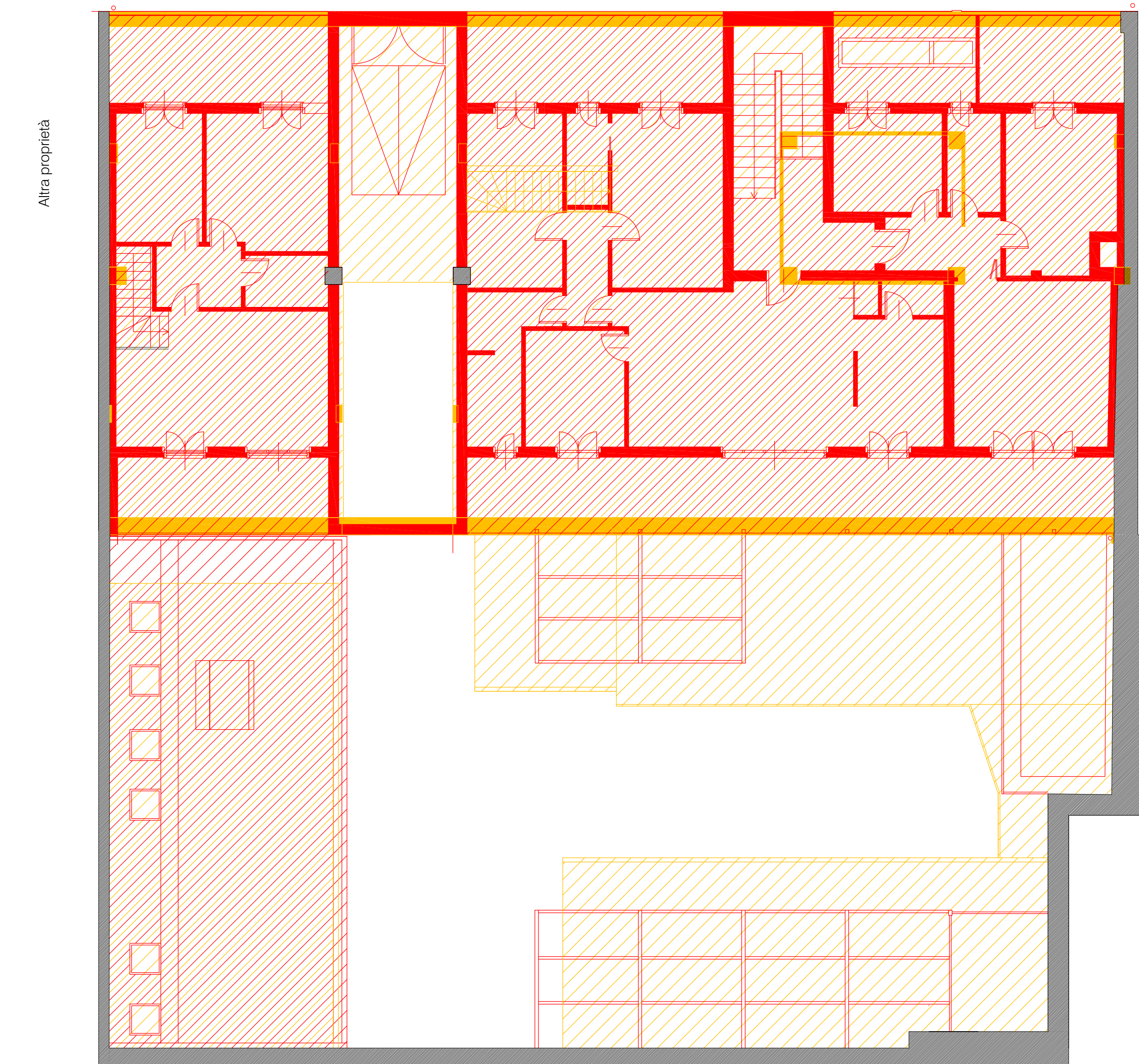
Pianta piano primo