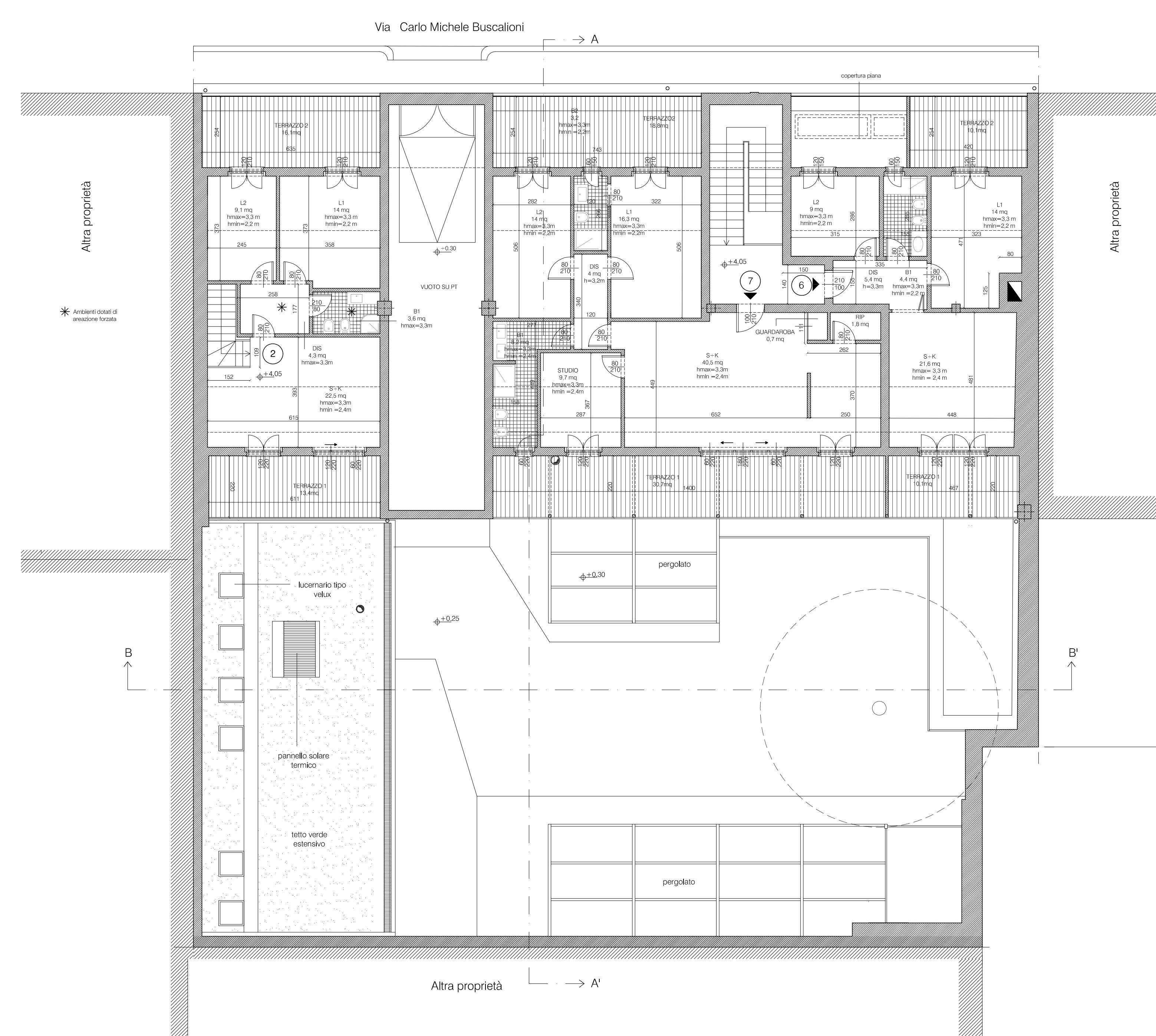
Pianta piano primo