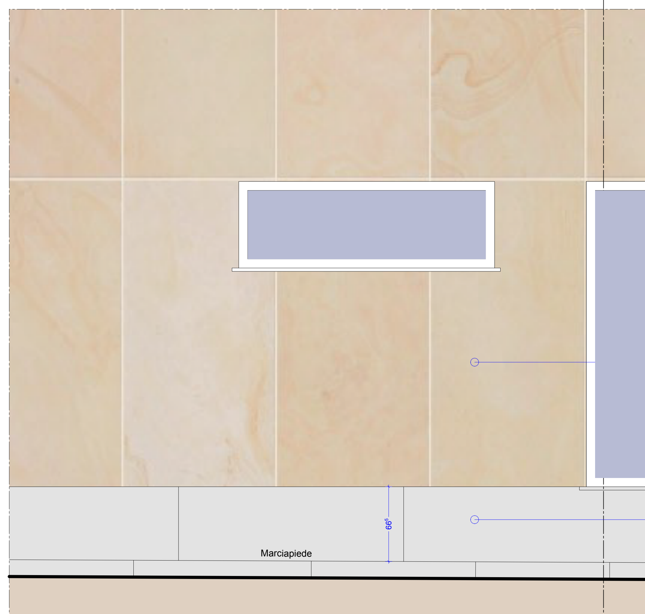
STRALCIO FACCIATA SU VIA 1:20 PIANO TERRA