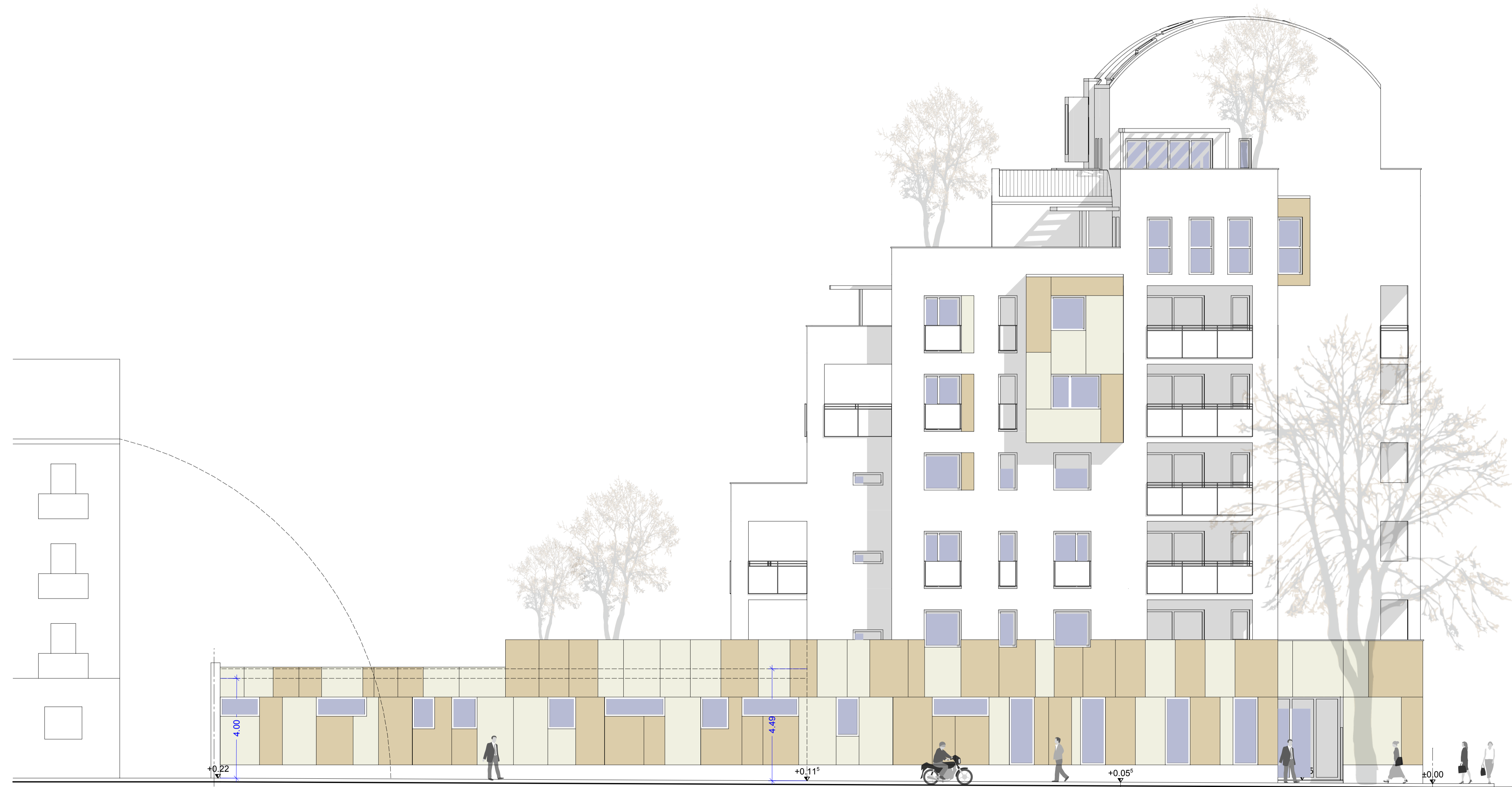
PROSPETTO VIA ASINARI INT 119 1:100