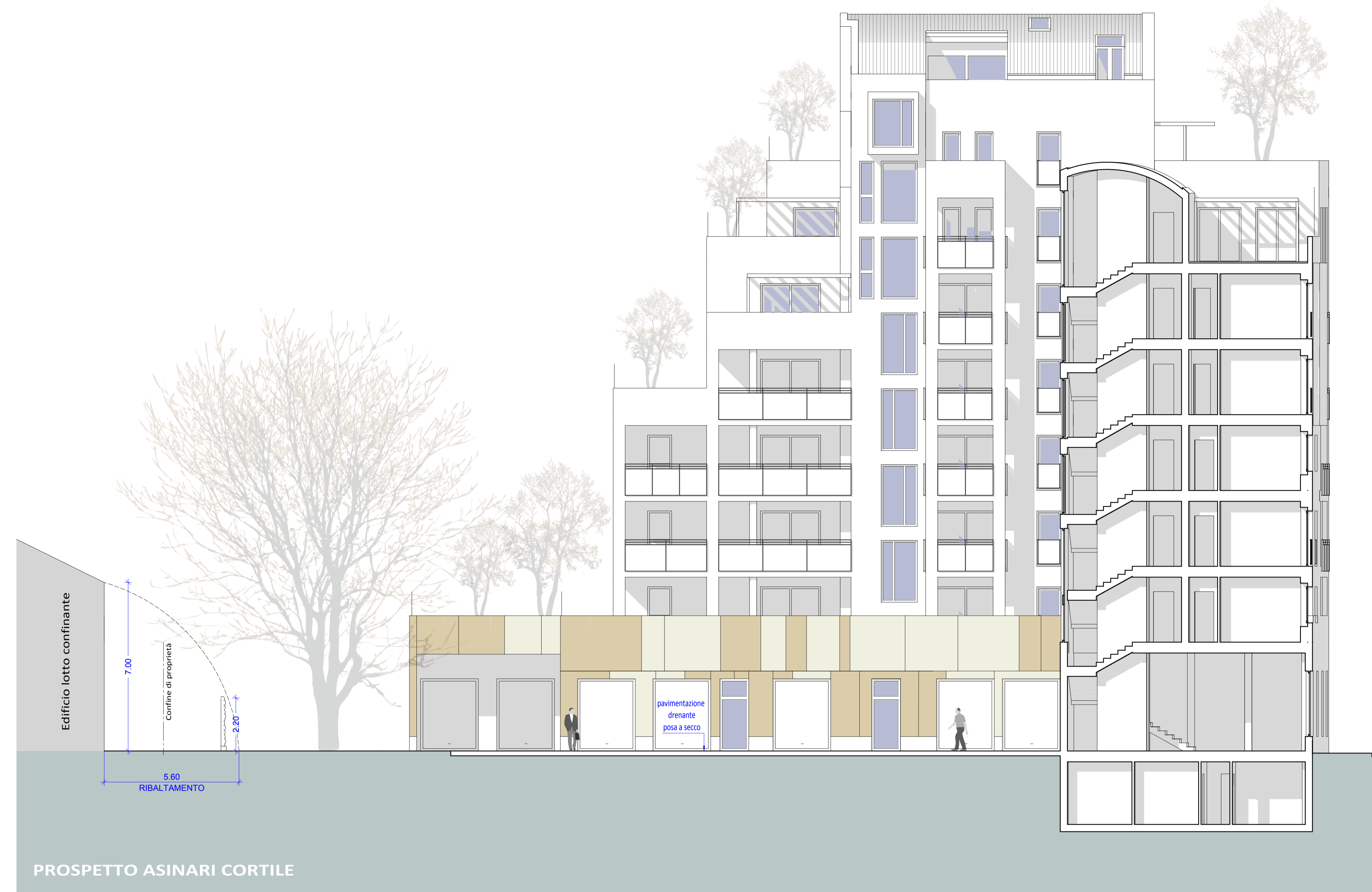
PROSPETTO ASINARI CORTILE