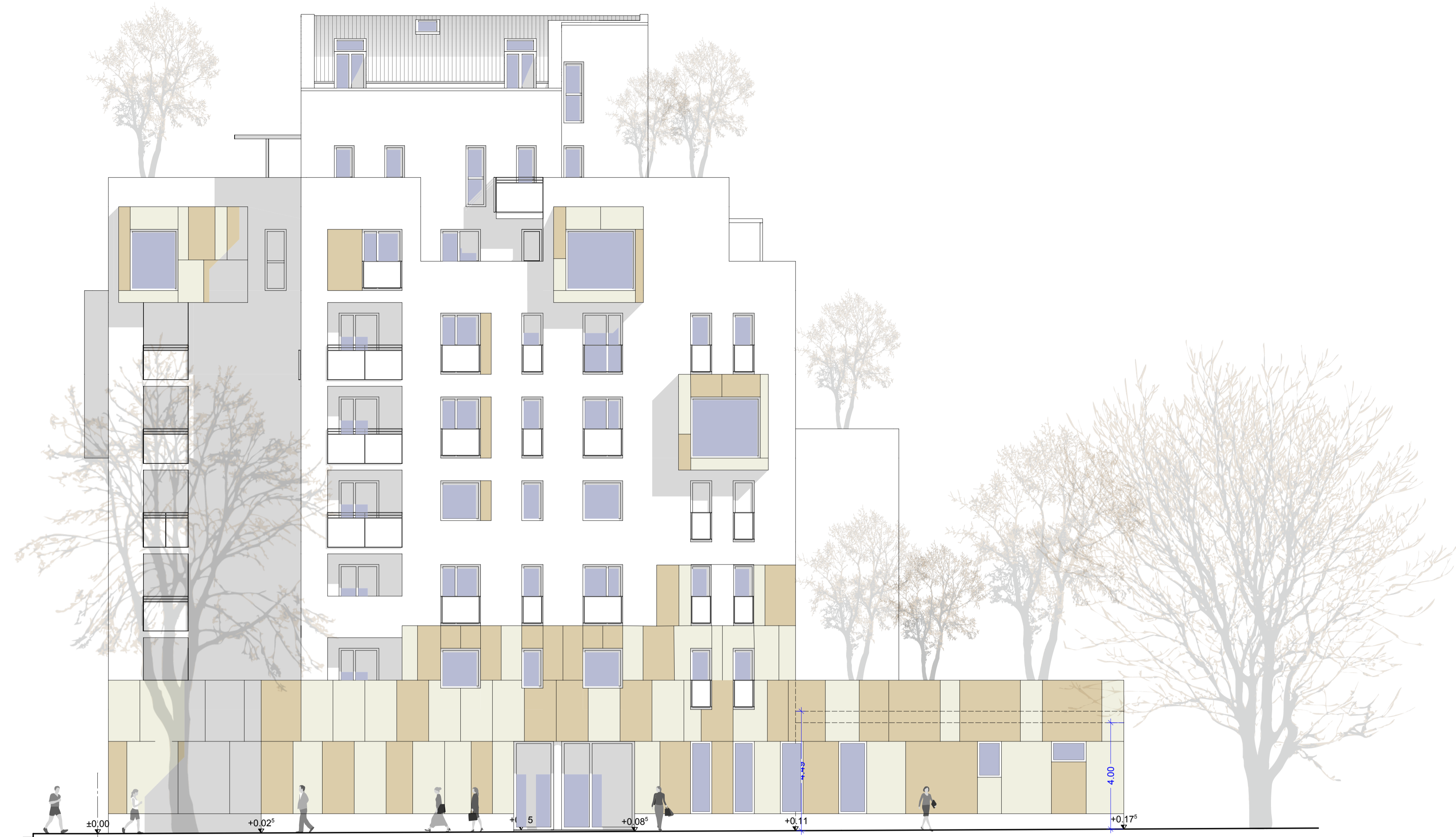
PROSPETTO VIA ASINARI 1:100