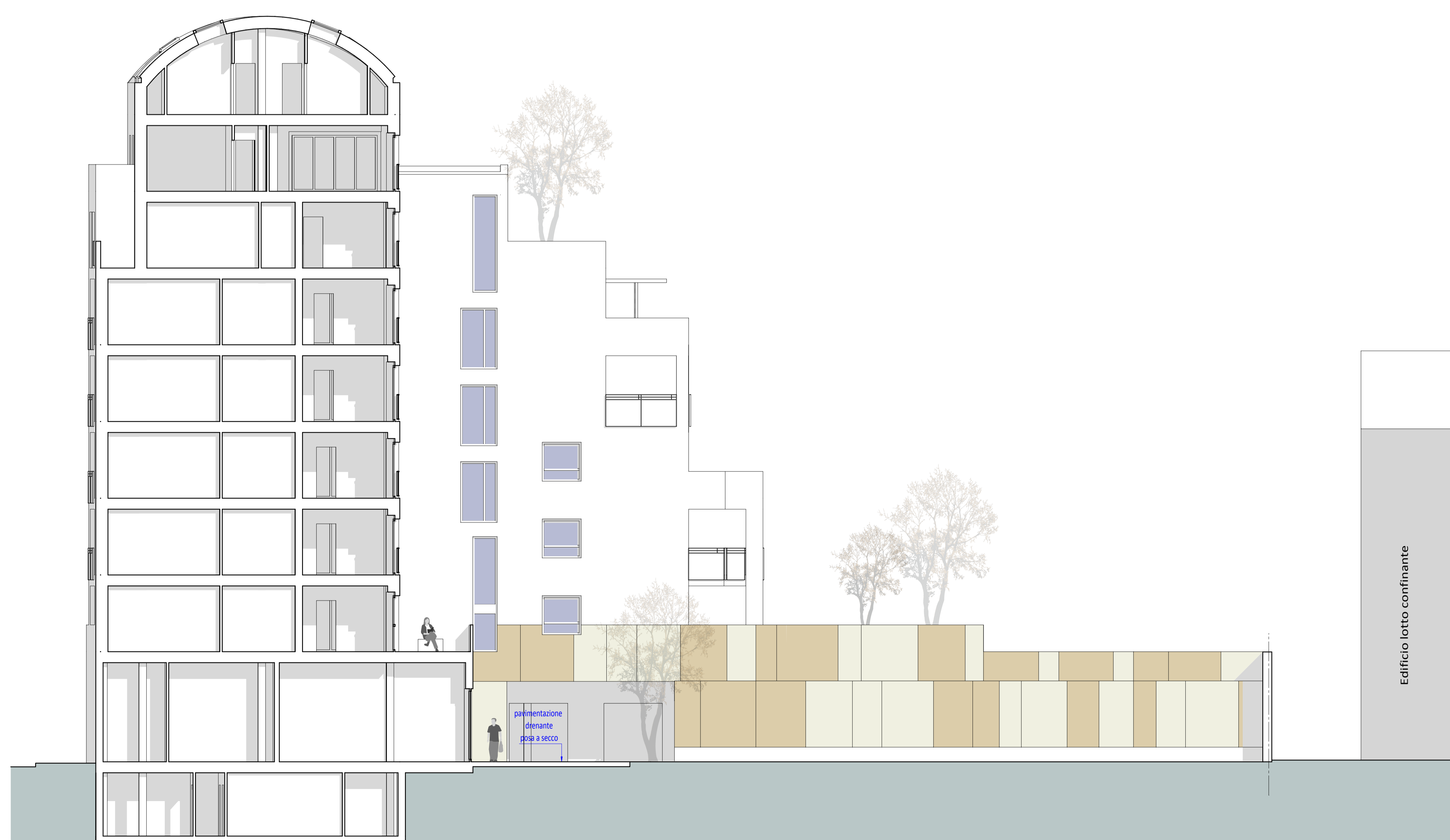
PROSPETTO INT 119 CORTILE