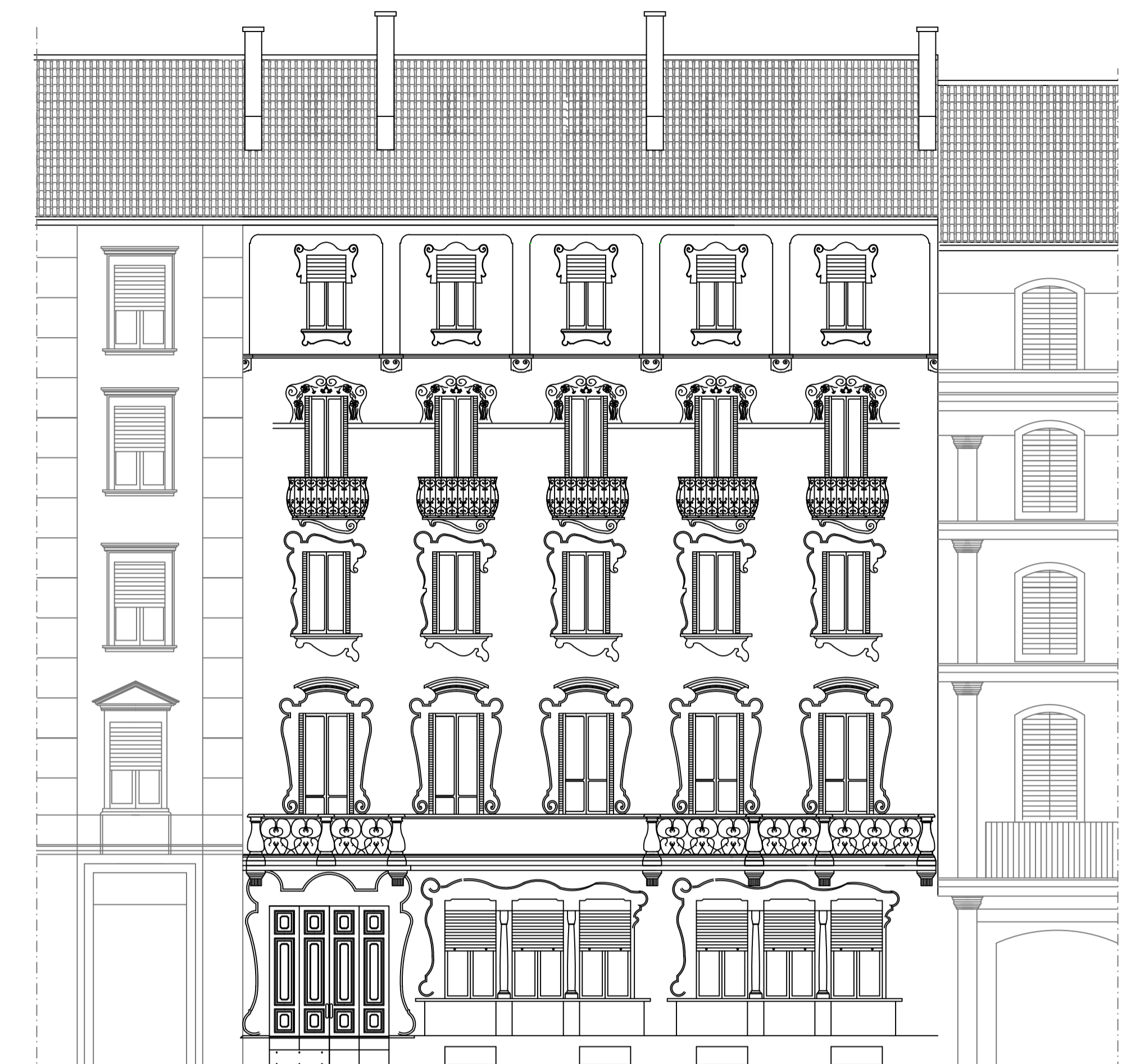
PROSPETTO LATO STRADA Stato di Fatto