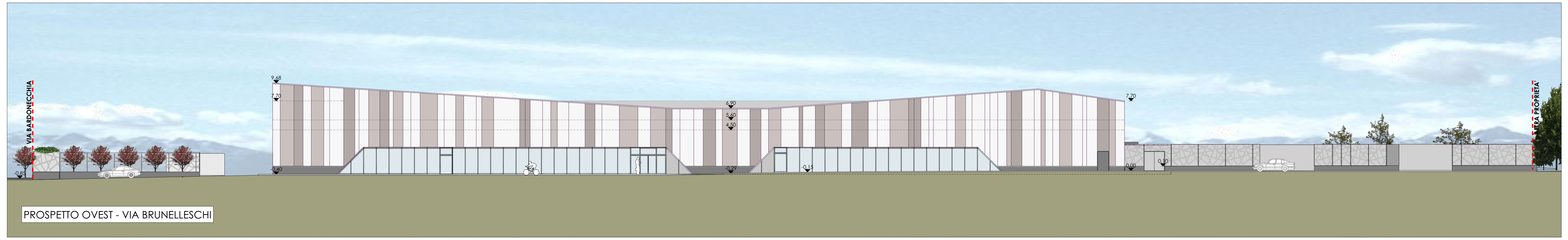
PROSPETTO OVEST - VIA BRUNELLESCHI