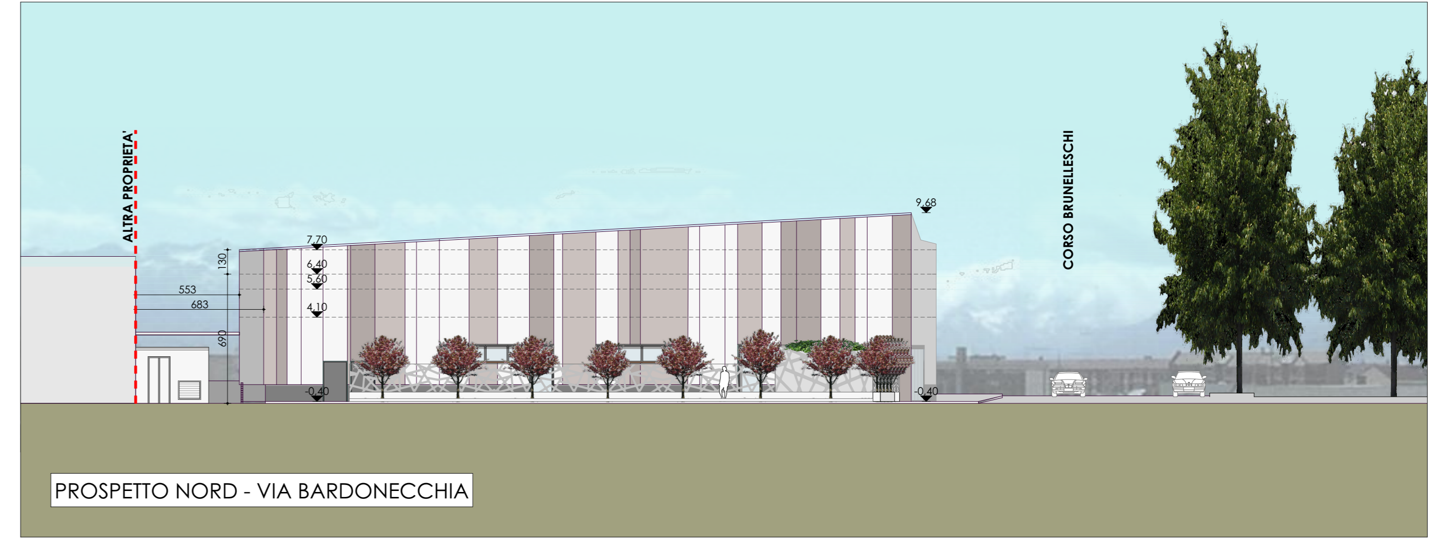
PROSPETTO NORD - VIA BARDONECCHIA