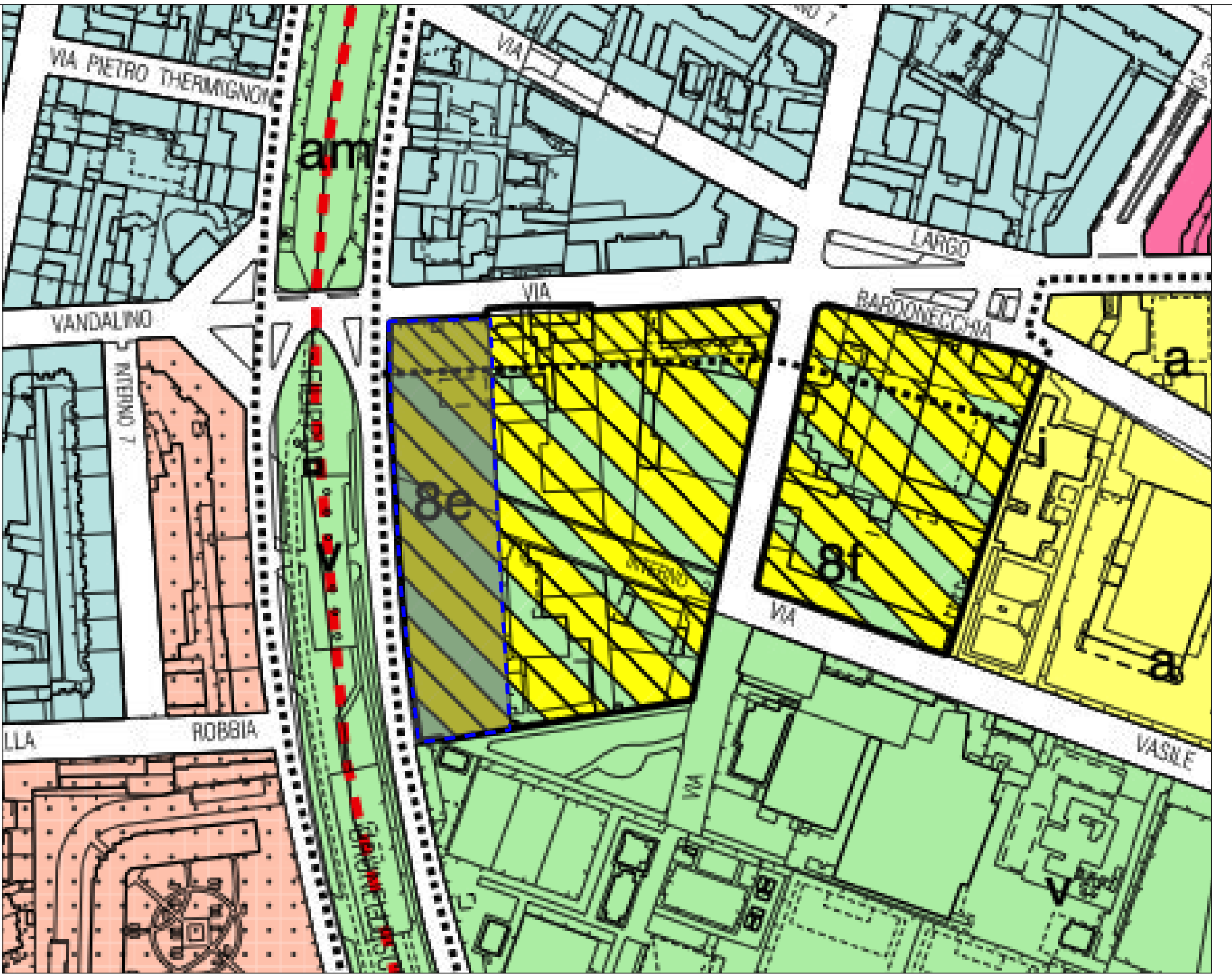
ESTRATTO DI PRG AREA ATS - AMBITO 8e - Trecate ovest SCALA 1:2000