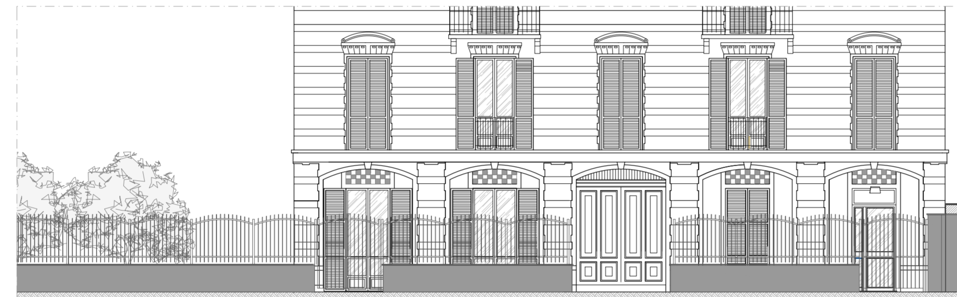
STATO DI FATTO_PROSPETTO EST CON CANCELLATA FRONTALE