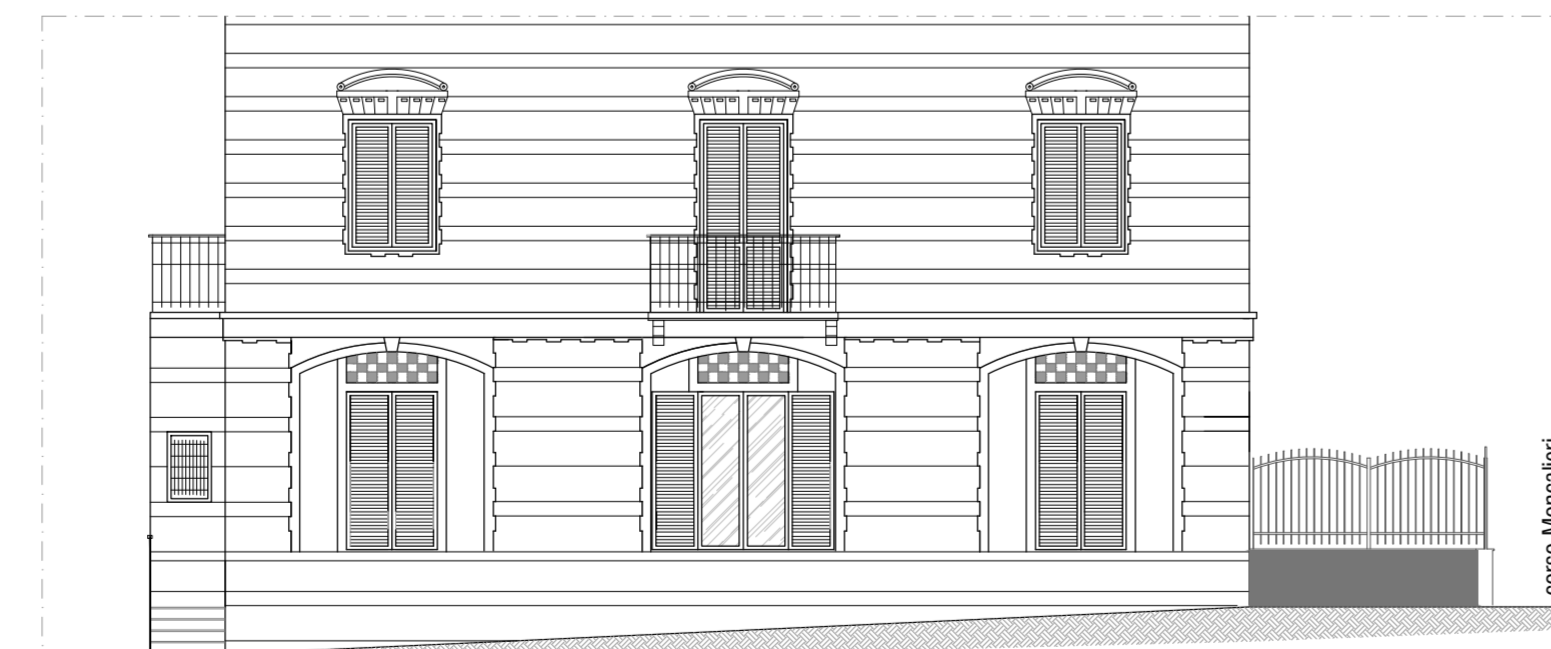
STATO DI FATTO_PROSPETTO SUD