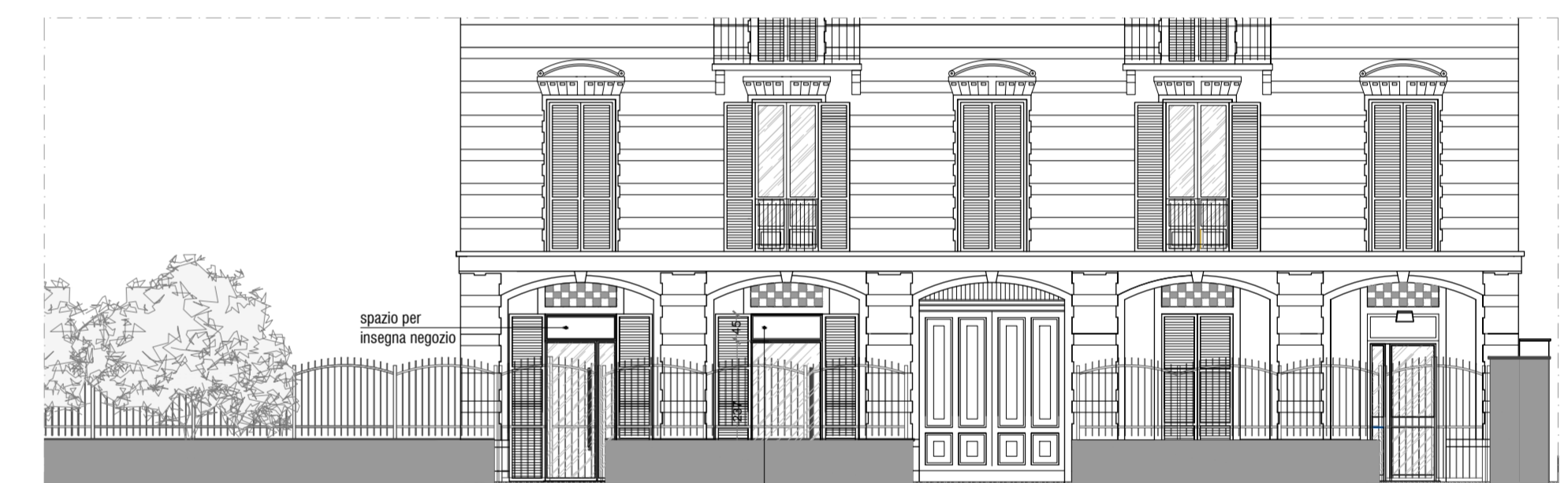
STATO DI PROGETTO_PROSPETTO EST CON CANCELLATA FRONTALE