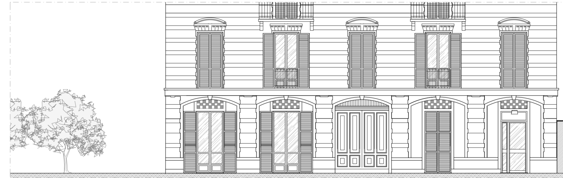
STATO DI FATTO_PROSPETTO EST