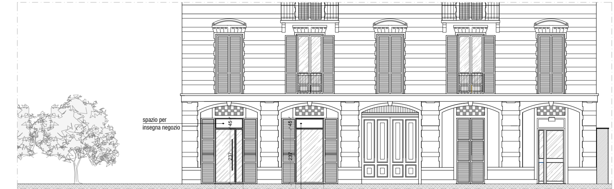
STATO DI PROGETTO_PROSPETTO EST