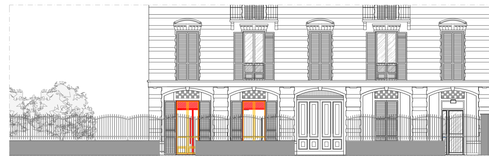
SOVRAPPOSIZIONI_PROSPETTO EST CON CANCELLATA FRONTALE