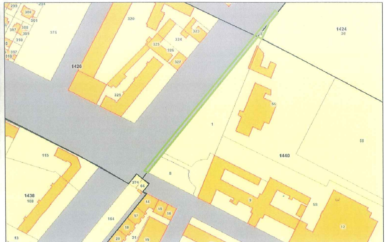
Catasto Terreni (Gis) - Scala 1:500