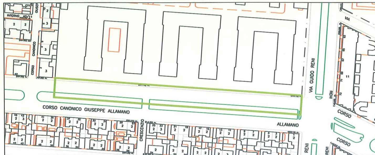
Carta Tecnica - Scala 1:500