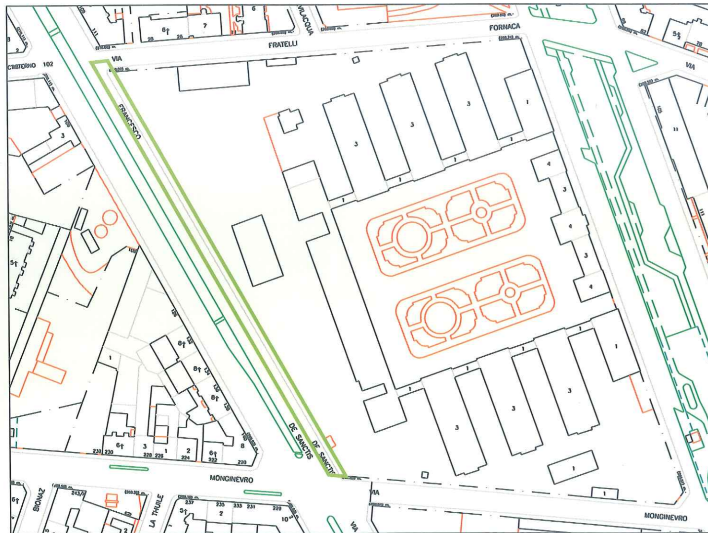
Carta Tecnica - Scala 1:500

Planimetrie con individuazione grafica puramente indicativa delle aree in oggetto.