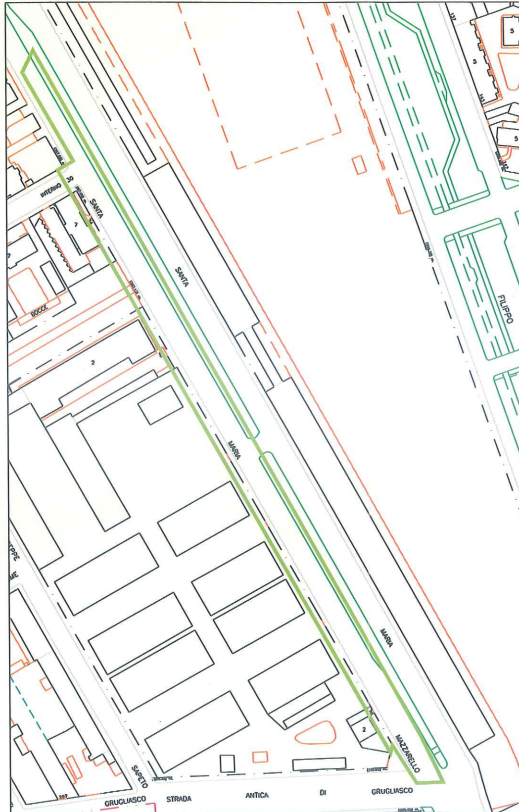
Carta Tecnica - Scala 1:500

Planimetrie con individuazione grafica puramente indicativa delle aree in oggetto.