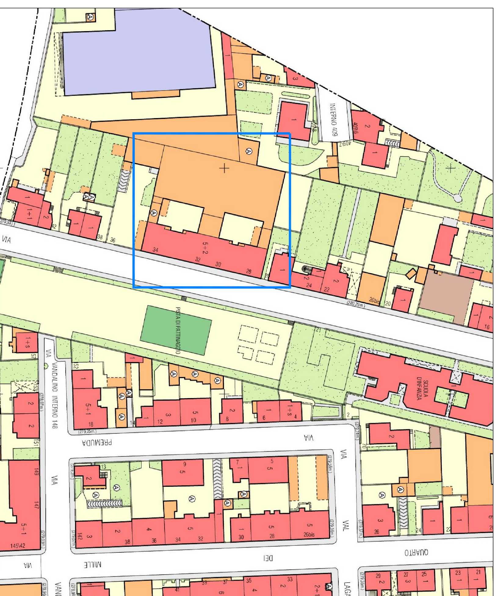
ESTRATTO CARTA TECNICA - SCALA 1.1000