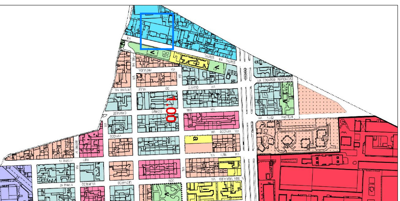
ESTRATTO PRG - SCALA 1.5000 AREA NORMATIVA M2