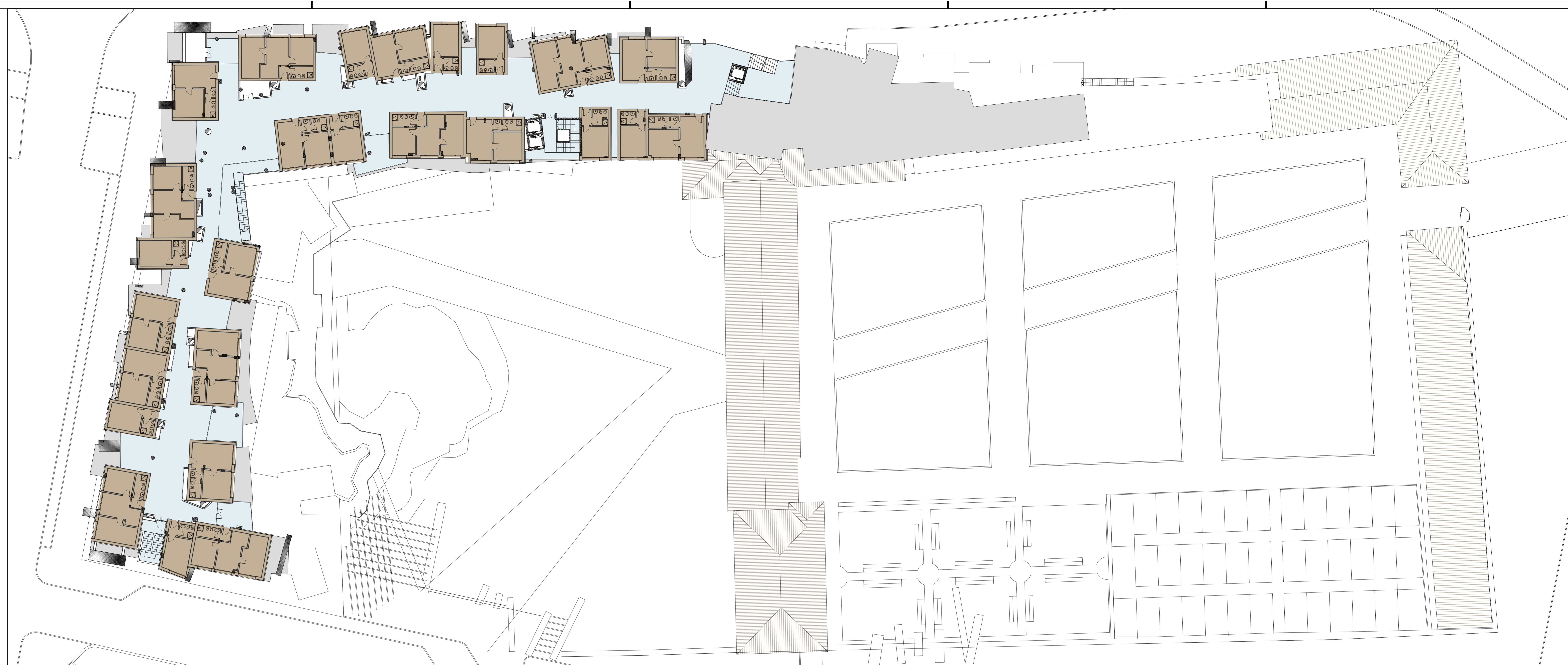
PIANTA PIANO TERZO