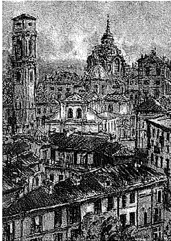
A. Mavaracchio: "Finestra su Torino"

DIVISIONE URBANISTICA ED EDILIZIA PRIVATA DIREZIONE URBANISTICA SETTORE STRATEGIE DI VALORIZZAZIONE URBANA VIA MEUCCI, 4